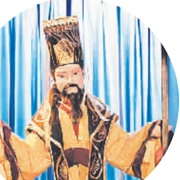
《来自中国的三个传说》中的木偶