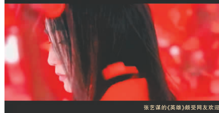
张艺谋的《英雄》颇受网友欢迎