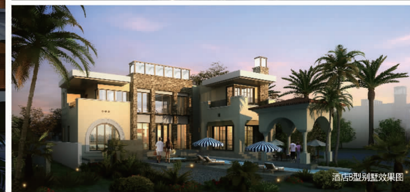
酒店B型别墅效果图