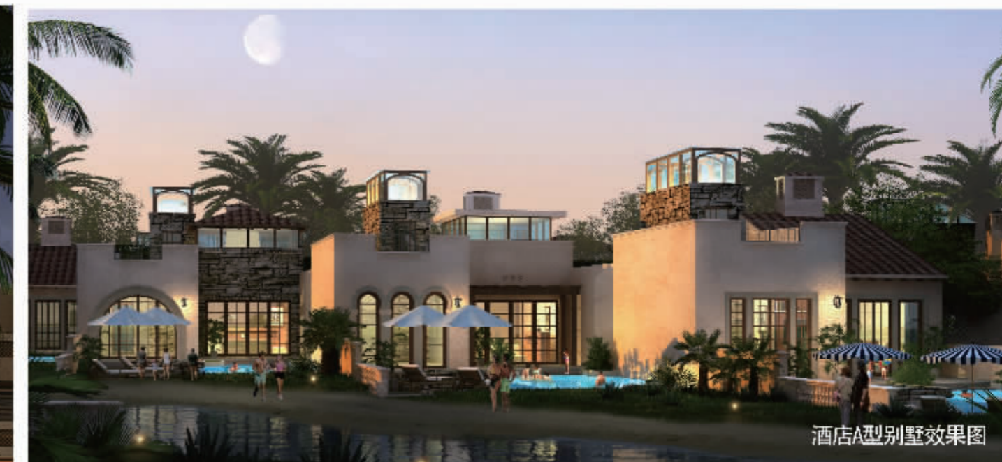
酒店A型别墅效果图