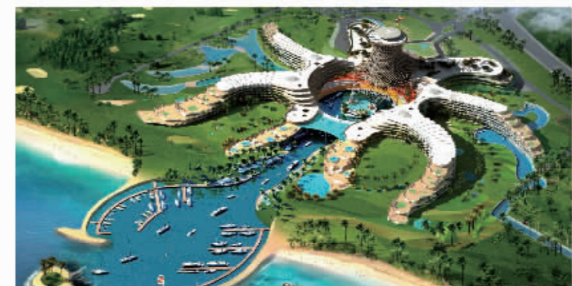
龙沐湾大酒店（八爪鱼酒店）

占地305亩，拟建客房(含套房)525间，总建筑面积10.45万平方米，投资预算15亿元，预计工期三年。项目建成后将与迪拜帆船酒店、悉尼歌剧院等世界著名海洋建筑比肩。 项目特点：1、游艇进大堂；2、海底餐厅；3、直升飞机停机坪等。