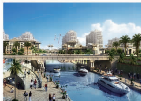
海水运河一期水街工程

西起渔人码头，东至温泉海景公寓商业会所，水街沿岸有一期工程商业中心、两所五星级酒店和温泉海景公寓一期项目。