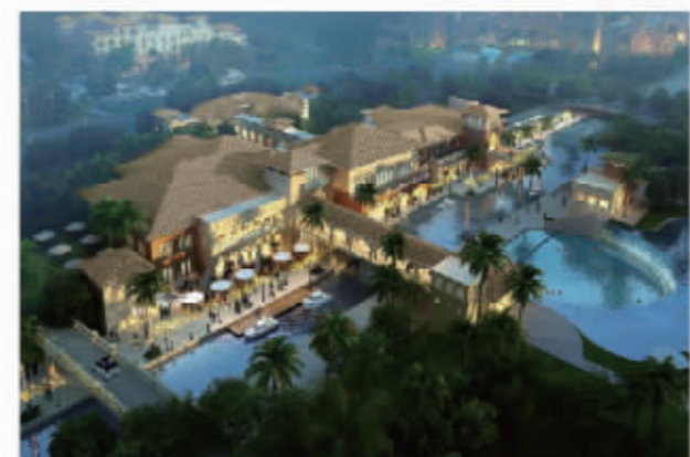
温德姆至尊豪庭花园酒店

项目占地约115亩，总建筑面积6.28万平方米，客房数363间/套，总投资5.3亿元。风格迥异的花园式设计，无处不在的水榭和花台，优雅安静的环境，让入住宾客拥有宾至如归的感觉。