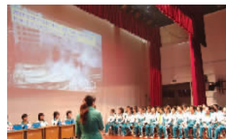
海口市举行安全知识竞赛