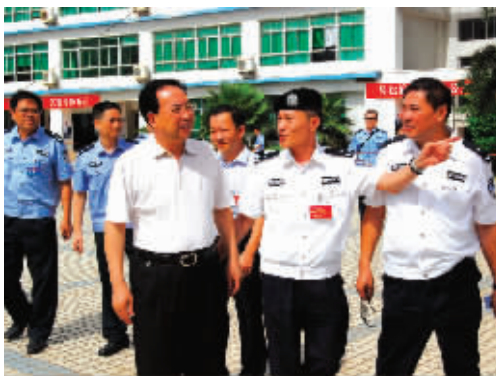
海口市委常委、市公安局局长宋顺勇(前排左一)在海口实验中学检查安保工作