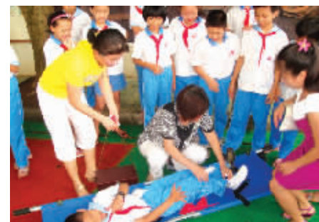
小学生们在学习如何护理伤者