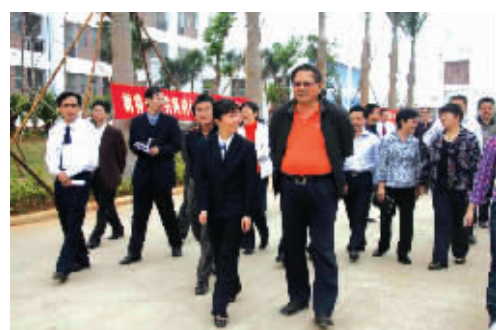
省委常委、海口市委书记陈辞(前排右一)到海口旅职校视察学校安全工作

据统计,自今年5月以来,海口市、区在加强学校及周边防控体系建设方面已累计投入1200多万元。目前,全市已建立起比较完善的校园及周边治安防控体系,提高了校园科技防范水平和校园处置突发事件的快速反应能力,广大师生也通过形式多样的法制宣传教育活动,不断增强遵纪守法的自觉性,提高自我保护、自我防范的能力。