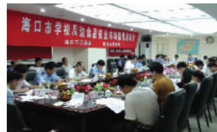
海口市工商局、教育局召开学校周边食品安全市场监管座谈会