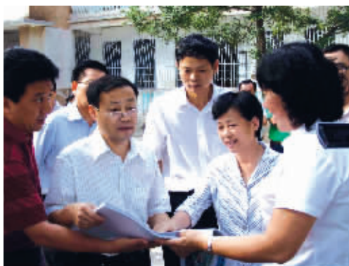
海口市委副书记、市长徐唐先(左二)视察海港学校安全工作