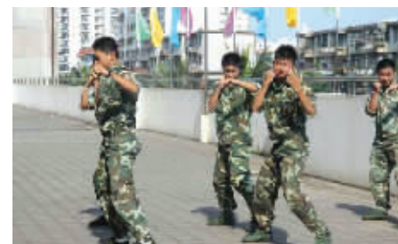
海口市校园保安员正在进行擒拿术培训