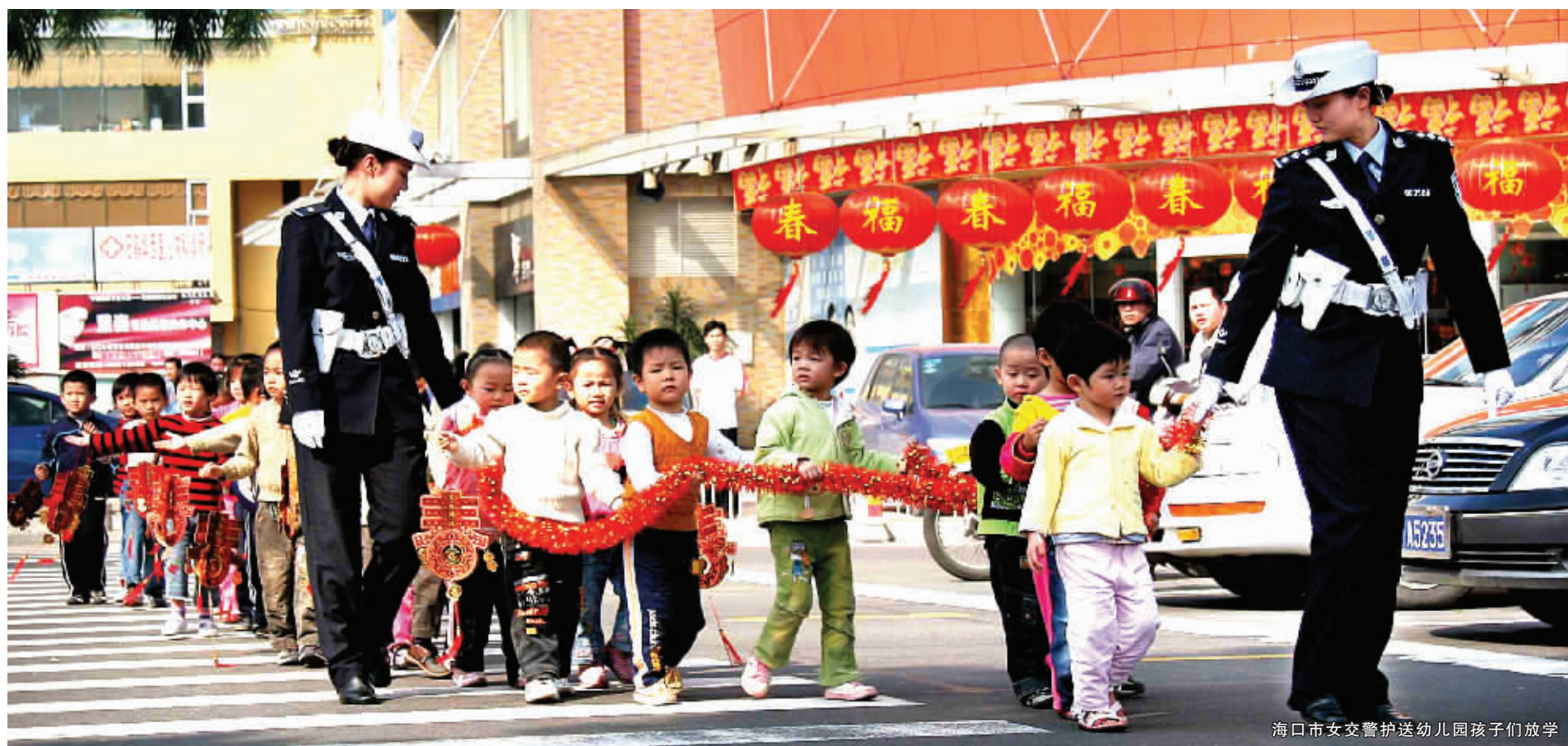
海口市女交警护送幼儿园孩子们放学

10月28日,全省校园及周边安全工作现场会在海口召开,海口市的经验得到了省委、省政府有关领导的充分肯定。会上,省市领导强调,学校安全工作重于泰山,各级党委、政府要以对人民生命高度负责的精神,认真贯彻落实中央和省委、省政府的要求,强化责任、健全机制,为全省校园安全工作创造一个平安和谐的社会环境。