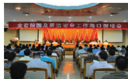
2010年10月28日,我省召开全省校园及周边安全工作海口现场会