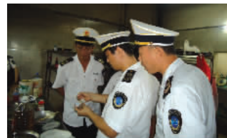
卫生部门检查学校食品卫生安全