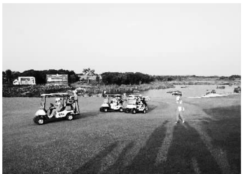
海口观澜湖1号球场风景如画。