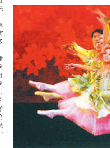
天津芭蕾舞团演出的《胡桃夹子》。

今年6月,在海南与天津之间开展的系列交流活动中,海南省文体厅带到天津的一台名为“相约天涯·牵手未来”的文艺演出,给游庆波留下了深刻印象,“演出的