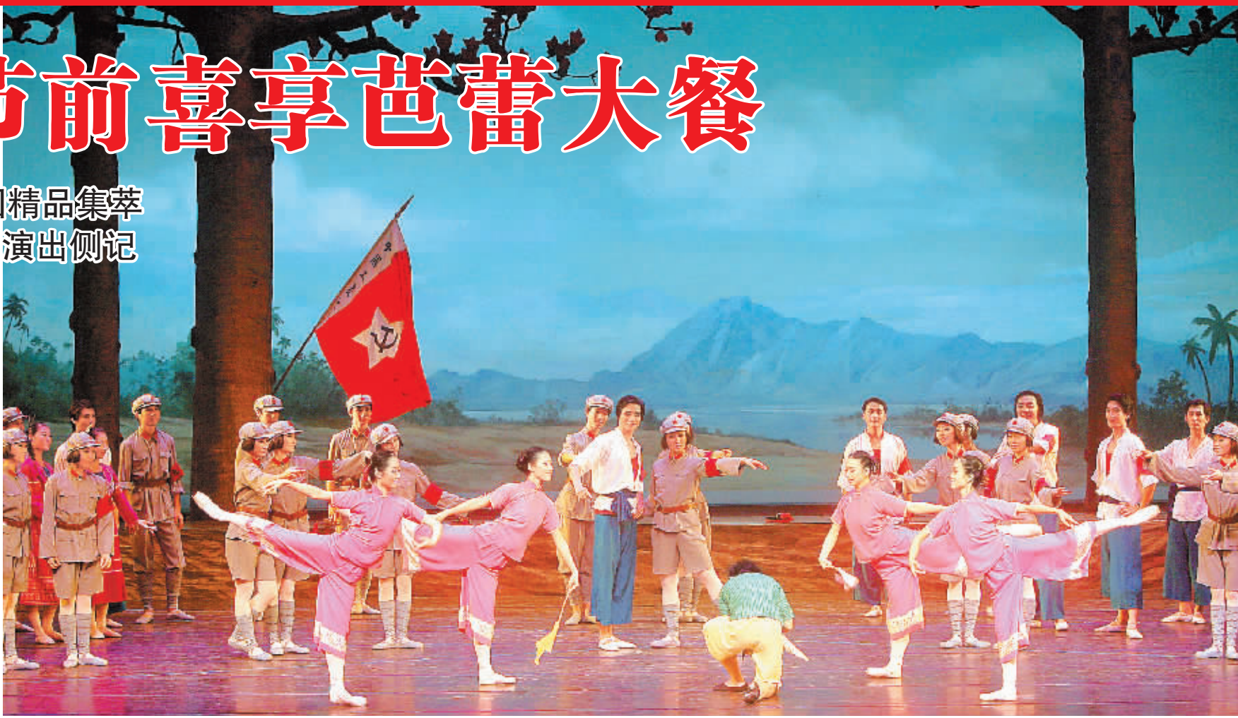
天津芭蕾舞团演出的《红色娘子军》。

优美的舞姿在椰风中摇曳,琼津文化交流又迈出了坚实的步伐,相信两地文艺团体的互访演出,将更加频繁,琼津人民将收获更多艺术大餐。(本报海口11月6日讯)