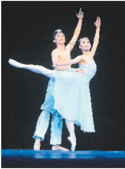
天津芭蕾舞团演出现场。