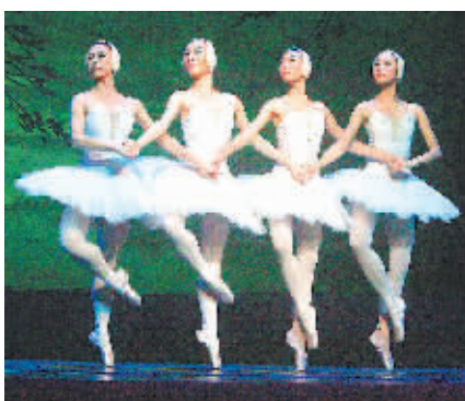
天津芭蕾舞团演出现场。