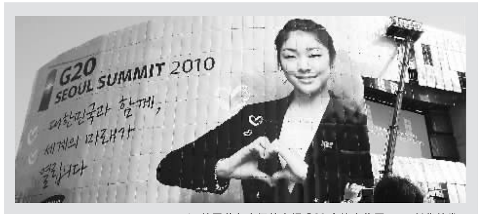
韩国首尔广场的大幅 G20 会议宣传画。