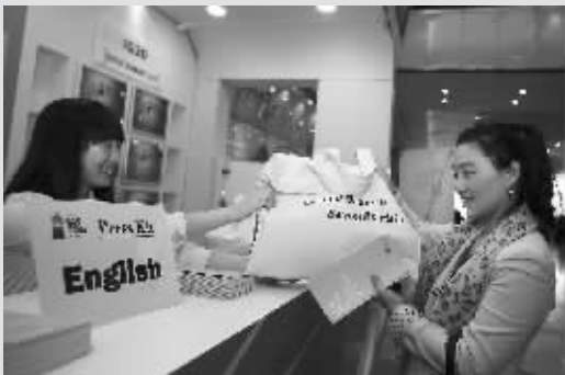
一名女记者在首尔 G20 峰会新闻中心入口领取报道资料。

一名行人经过位于韩国首尔 COEX 贸易中心的二十国集团(G20)峰会媒体新闻中心。该中心包括1330个座位的主新闻中心和可容纳电视台132个报道间的国际放送中心(IBC)等。