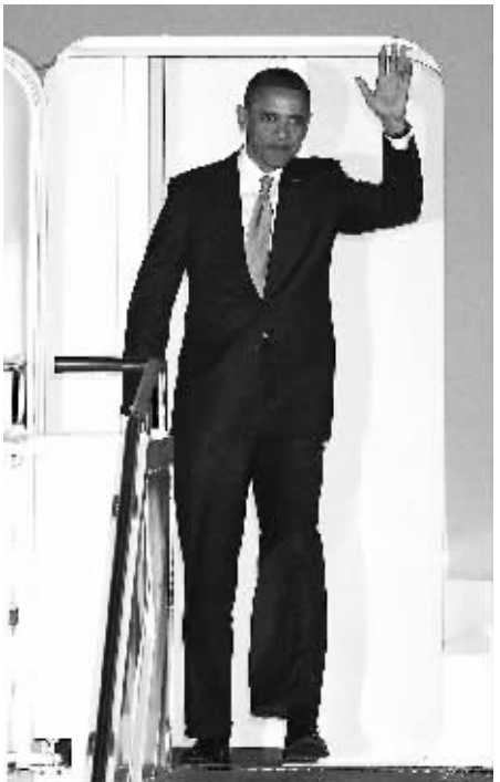
11月10日，美国总统奥巴马抵达韩国首尔机场。