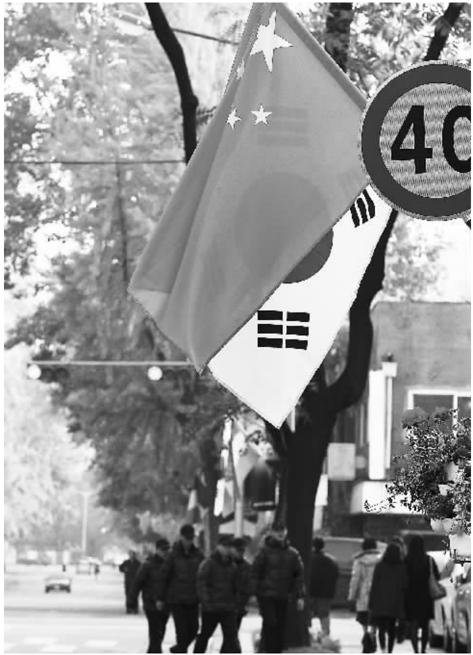
在韩国首都首尔，总统府青瓦台附近的道路两旁竖起了迎接二十国集团(G20)峰会举办的标语和旗帜。

韩国企划财政部宣布，将“积极”考虑采取措施，控制资本涌入。印度尼西亚官方也表示，将出台措施应对热钱流入。