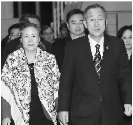
11月10日凌晨，前来出席首尔 G20 峰会的联合国秘书长潘基文携夫人抵达韩国首尔仁川机场。