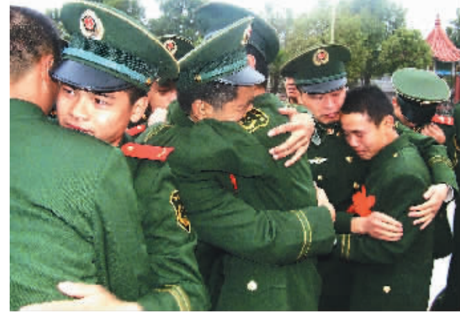
11月24日,武警江西新干中队退伍老兵与战友挥泪告别。初冬时节,又到一年退伍时。全国各地退伍老兵采用多种方式告别火热的营房和朝夕相处的战友,表达浓浓的情意。