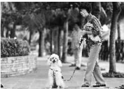
近日,一名由郑州来三亚过冬的老人在大海边遛狗。由于免签国数量的增加以及东北的大雪,业内人士估计本月来三亚的候鸟比去年同期增加一成以上。

本报讯 (记者郭景水)记者从三亚市凤凰镇获悉,该镇决定选拔16名30周岁以下的三亚市凤凰镇户籍、国家承认的全日制普通大专以上学历的大学毕业生,充实到该镇的行政村和社区居委会,担任村(居)党组织副书记、村(居)委会主任助理,以改善村(居)干部的年龄文化结构,提高村(居)干部队伍整体素质。