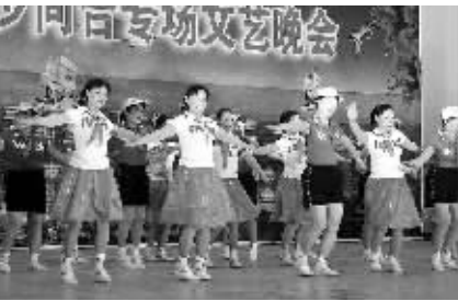
近日,三亚市关心下一代工作委员会、三亚市委老干部局将一台精彩的文艺演出送到了该市凤凰镇水蛟村。