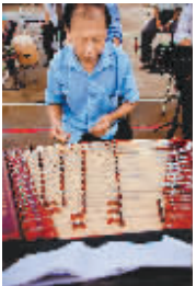
大多数都集中在儒杨村等周边村庄。灵山的八音传承人约有五六百人，