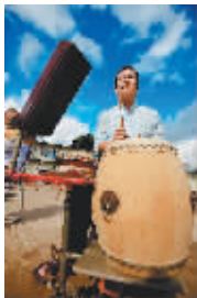
音乐的重要发祥地之一。灵山镇是海南民间八