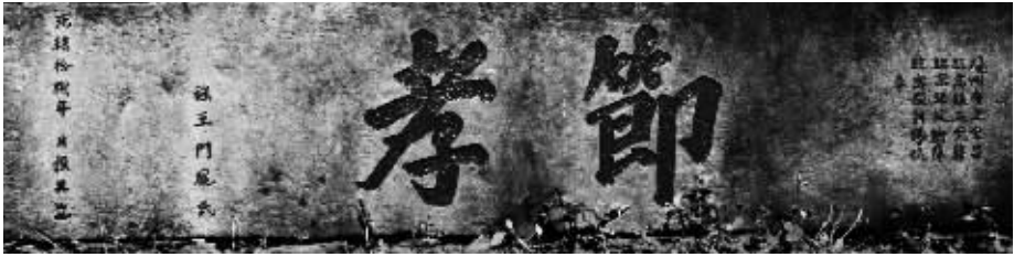
清代留存至今的节孝坊