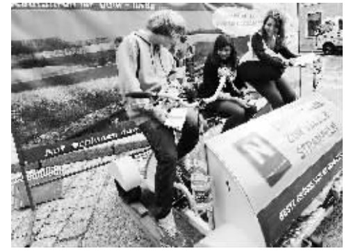
在奥地利首都维也纳纳瑟夫施泰特大街,几名年轻人体验一种可以在铁轨上行走的脚踏车。