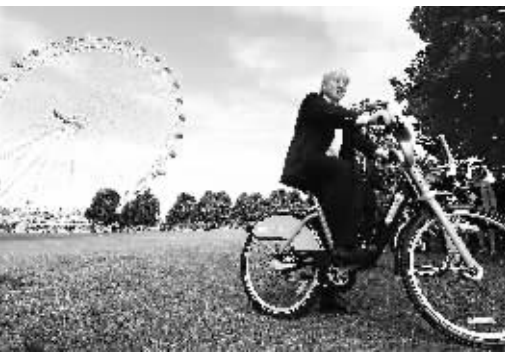
在英国伦敦的“伦敦眼”摩天轮附近,伦敦市长鲍里斯·约翰逊为自行车出租计划做宣传。