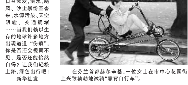
在芬兰首都赫尔辛基,一位女士在市中心花园街上兴致勃勃地试骑“靠背自行车”。