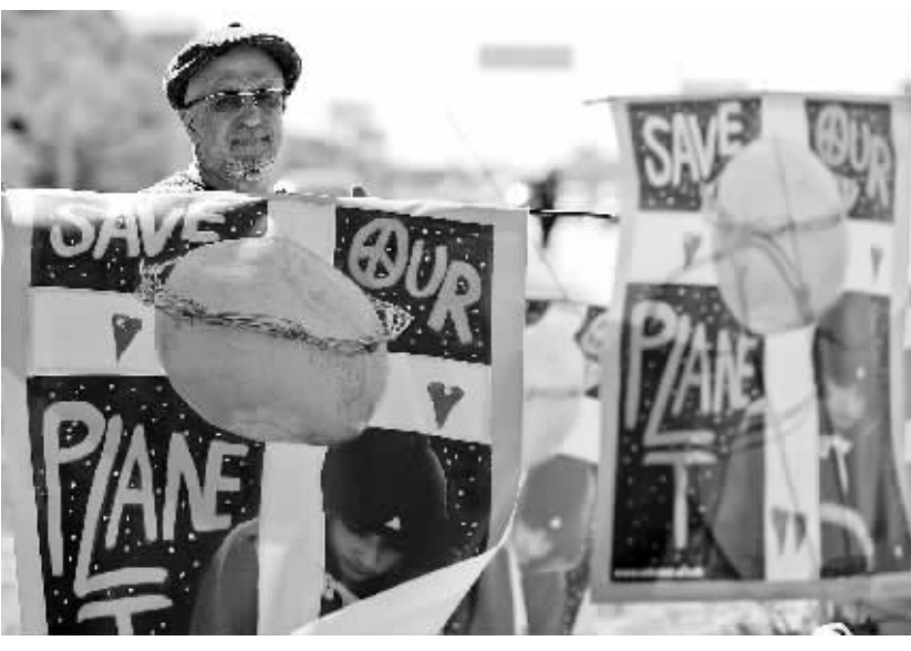
十一月二十九日,游行者在墨西哥坎昆举行的联合国气候变化会议会场外呼吁拯救地球。

全球控温目标无法实现 坎昆“月亮宫”海滨酒店11月29日迎来《联合国气候变化框架公约》第16次缔约方会议暨《京都议定书》第6次缔约方会议。