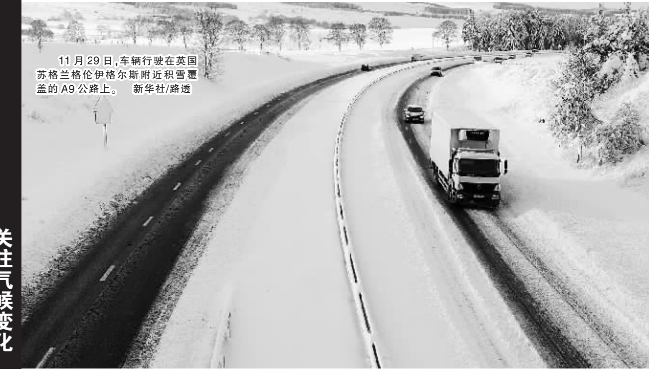
11月29日,车辆行驶在英国苏格兰格伦伊格尔斯附近积雪覆盖的A9公路上。

据日本气象厅观测,地震发生在当地时间12时25分许,震中位于小笠原群岛以西海域,具体地点是北纬28.4度,东经139.7度,震源深度约480公里。