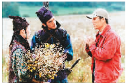
张艺谋(右)拍《十面埋伏》时为金城武(中)、章子怡说戏

张会军(新华社北京11月30日电) 从张艺谋被破格录取上学的事情,我认为有如下几点启示: 其一,“破格录取”在当时符合“尊重知识、尊重人才”的思想解放趋势。 其二,文化部的领导慧眼识才,敢于破格录取具有特殊才能的学生,体现了艺术学院招生特点的特色。 其三,北京电影学院由于招收、培养了张艺谋,为后来改写中国电影的历史现状作出了巨大贡献。 其四,张艺谋是高考制度的受害者,机遇对任何人都无比珍贵,唯有不懈努力、牢守把握。 其五,没有领导的决定、没有学院的教师、没有良好学习环境,没有张艺谋的刻苦,历史可能会是另外一个样子。好在,我们共同书写了世界和中国电影史上的一段佳话人物。