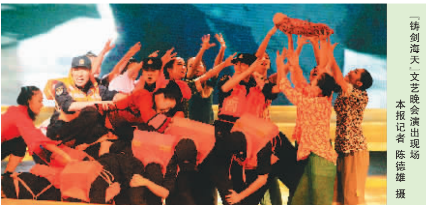
“铸剑海天”文艺晚会演出现场

本报海口11月30日讯 (记者戎海 通讯员寇永强 贾文峰)今晚,南海舰队航空兵“铸剑海天”文艺晚会,在海南歌舞剧院上演。这台由南海舰队官兵自编自导的晚会,以歌舞、小品、快板、诗朗诵等艺术形式,歌颂了官兵们为国戍边、无怨无悔的奉献精神,展示了新一代军人开朗乐观、积极向上的精神风貌。 晚会在舞蹈《列阵蓝天》中拉开帷幕,阳刚律动的舞剧节奏,将我战机组编在南海上空穿云破雾的场景呈现在台上;情景剧《情系阅兵》以南航某部代表海军参加国庆阅兵为主线,截取三幕感人场景,再现了官兵们荣耀背后不为人知的艰辛;群口快板《雄鹰风采》讲述几代南航官兵顽强拼搏、艰苦创业的故事;配乐诗朗诵《巡航亚丁湾》以官兵参加远航护航任务为线索,讲述南海雄师舰艇出征亚丁湾的历程。 除表现部队训练和战斗场景外,晚会也展现了新时期军人丰富多彩的内心世界。女声独唱《当兵的女儿在远方》,唱出了天涯女兵对母亲的思念;小品《如此创新》将顺口溜、街舞、网络语言等时尚元素混搭,在轻松幽默的氛围中勾勒了新时期南航官兵生活、聪慧的女性;舞蹈《新时期的娘子军》展示了南航官兵的生活片断。 此外,南航官兵冒雨营救海南受灾群众的壮举也被搬上了舞台。舞蹈《风雨同舟》用视频和舞蹈相结合的手法,真实再现了军民鱼水一家亲的深厚情谊,精彩表演引起观众强烈共鸣,台下多次爆发出热烈掌声。晚会在阳刚大气的歌舞《使命如山》中落幕。