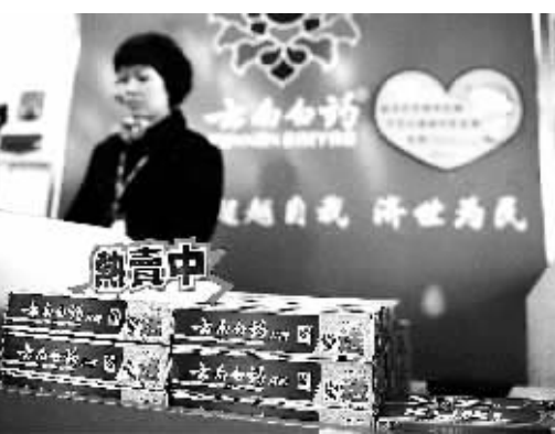
昆明的云南白药大药房内，店员正在收银。

近日有网友发帖称美国FDA网站上挂出了一份“云南白药”的详细成分表，在网上引起轩然大波。云南白药被列为国家保密品种、国家一级保护品种，网友因此质疑“保密配方只对国人保密，对外国人不保密”。