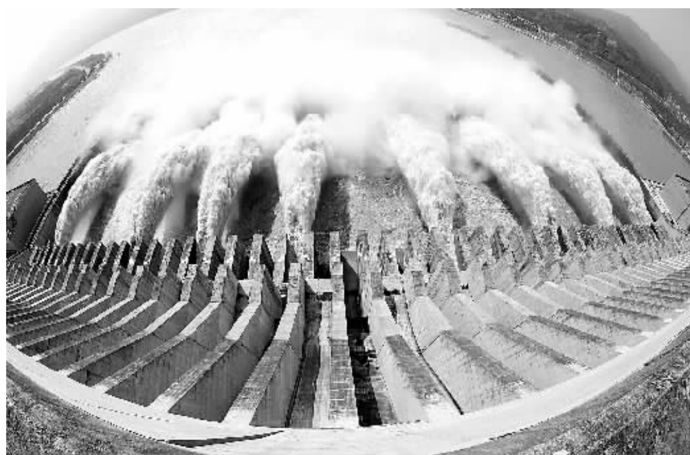
今年7月三峡大坝泄洪的壮观场面。(资料照片)