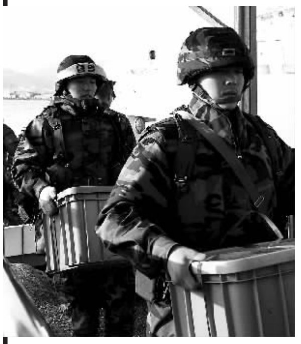
温家宝(左)与巴基斯坦总理吉拉尼(右)在会谈中交谈。

据新华社伊斯兰堡12月17日电(记者张琪 谭晶晶)国务院总理温家宝17日在伊斯兰堡与巴基斯坦总理吉拉尼举行大、小范围会谈,就双边关系、地区形势和重大国际问题友好、坦诚、深入地交换看法,达成广泛共识。