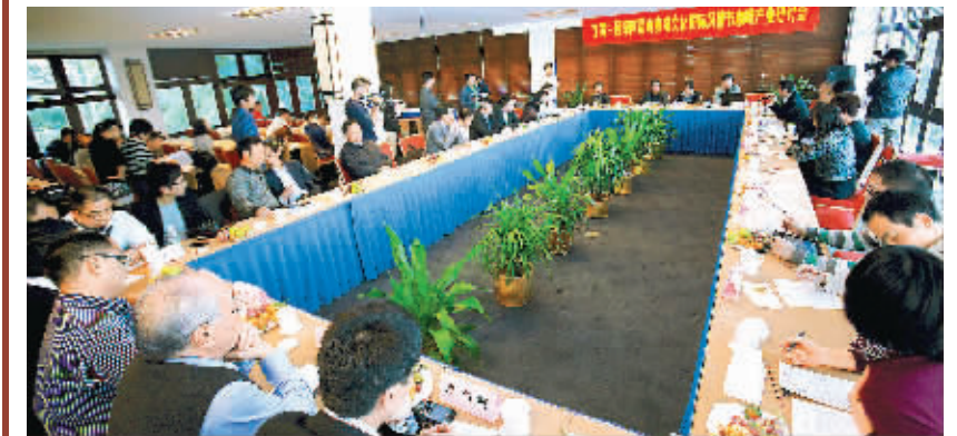
12月29日，首届中国海南福山咖啡文化国际风情咖啡产业研讨会在澄迈县盈滨半岛举行。

海南日报记者注意到，今天签约的项目涉及农业、工业、基础设施、旅游和文化教育五大类，大部分位于老城经济开发区，其中基础设施方面的项目，很受澄迈县看