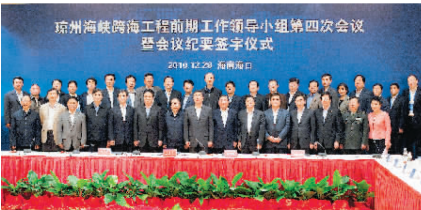
12月29日下午，交通运输部、铁道部、广东省和海南省在海口举行琼州海峡跨海工程前期工作领导小组第四次会议暨会议纪要签字仪式。本报记者 宋国强 摄

据悉，项目建议书推荐的主要技术标准按铁路二线、客货分线运输，客线、货运速度目标值为160公里/小时、120公里/小时；公路为双向8个车道，等级高速公路。主要建设方案有3个，西线公铁合建桥梁方案、中线公铁合建桥梁方案、中线铁路隧道和西线公路桥梁组合方案，可研阶段将进行深入比选。