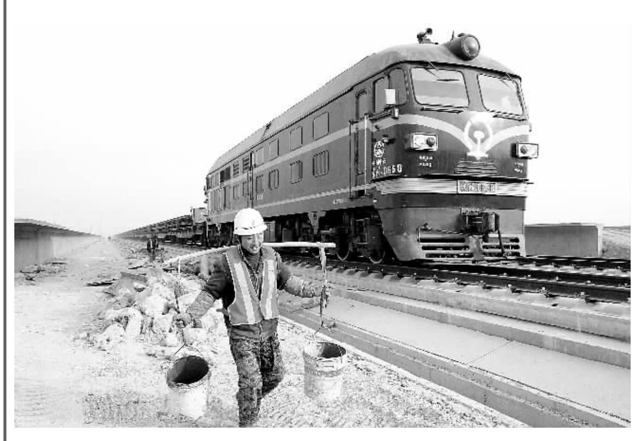
1月3日，一名工人在建设中的石家庄至武汉高速铁路客运专线河北邯郸站内作业。

据新华社北京1月4日电(记者齐中熙)铁道部部长刘志军4日在全国铁路工作会议上表示，今年我国高速铁路运营总里程将突破1.3万公里，初步形成覆盖面更广、效应更大的高铁网络。