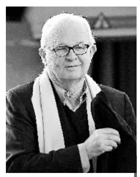
1月4日,美国朝鲜问题特使斯蒂芬·博斯沃思抵达韩国仁川国际机场,开始他对韩国为期两天的访问。

报道称,韩国政府的设想是:待韩朝关系出现改善、朝鲜满足重启六方会谈条件之后,朝美、朝日应举行双边接触,进而再行重启六方会谈。美国朝鲜问题特别代表博斯沃思4日下午抵达首尔。韩国外交通商部说,博斯沃思将与韩国外长金星焕和朝核问题六方会谈韩国团团长魏圣洛举行会晤,讨论朝核问题“现状和今后应对方向”。