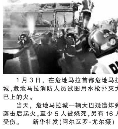
1月3日,在危地马拉首都危地马拉城,危地马拉消防人员试图用水枪扑灭大巴上的火。