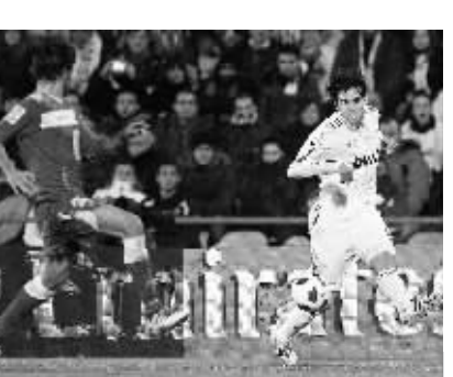
卡卡归来 1月4日,在西甲第17轮比赛中,皇家马德里客场3:2战胜赫塔菲队。因伤告别马德里的卡卡此战伤愈正式复出,他在下半场替补出场。图为卡卡在比赛中带球突破。 新华社发

据新华社济南1月4日电(记者赵仁伟)山东鲁能泰山足球俱乐部4日晚宣布,在鲁能俱乐部效力6年的中国足球队名将李金羽正式退役。同时退役的还有鲁能老将舒畅和高尧。 鲁能俱乐部表示,李金羽、舒畅、高尧等队员向俱乐部表达退役请求后,俱乐部经慎重研究并报请董事会批准,4日晚作出决定,同意三名队员退役请求。据悉,鲁能俱乐部曾极力挽留李金羽,但最终尊重了其本人的意见。 今年33岁的李金羽是辽宁沈阳人,1993年入选中国健力宝少年足球队赴巴西留学,并成为国家队的首席射手。2004年自辽宁队转会山东鲁能队后,三次帮助鲁能队获得中超联赛冠军。2007年,李金羽成为中国职业足球联赛历史上首位攻入100粒进球的射手。