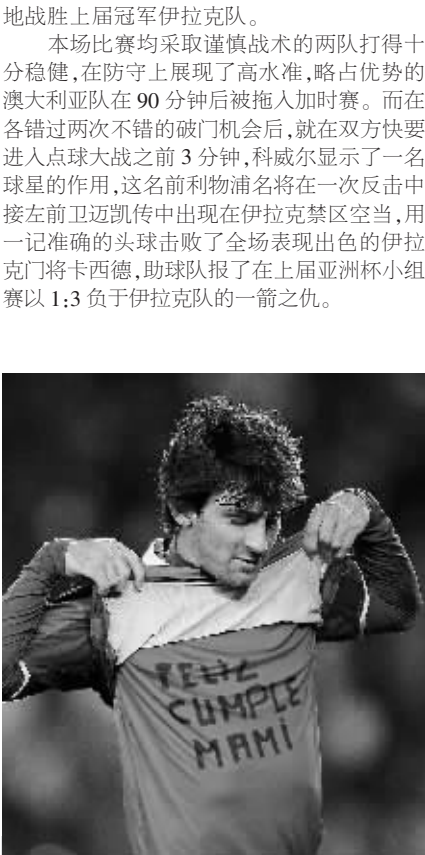
北京时间1月23日凌晨,在西甲联赛第20轮比赛中,巴塞罗那队主场以3:0战胜桑坦德竞技。图为梅西进球后展示身穿在身上的印有“妈妈生日快乐”的T恤衫。