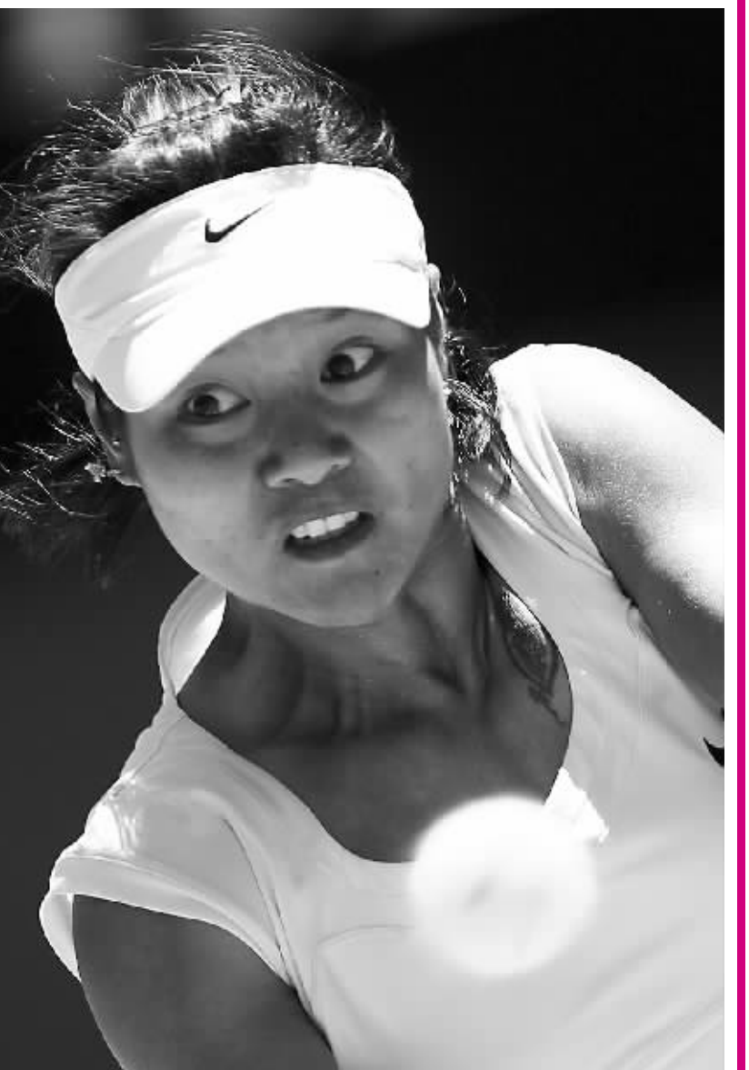
1月23日,李娜在比赛中全神贯注准备击球。

郭晶晶从1995年首次参加世界比赛至2009年底,共摘得31项世界冠军头衔,她在雅典和北京奥运会上蝉联了单人项目和双人双料冠军,并创造了世锦赛五连冠的纪录。