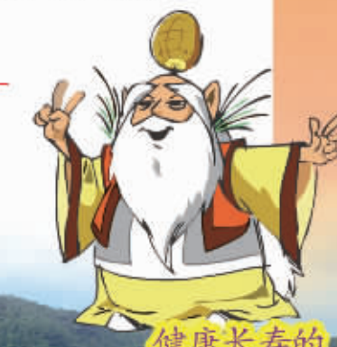
健康长寿的 南砂哥