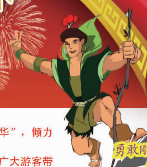
勇敢刚毅的 巴戟哥