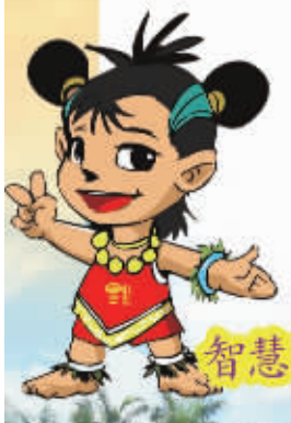
智慧活泼的 益智娃