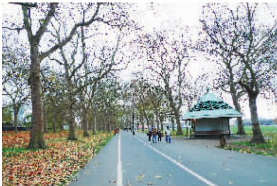
海德公园里道路两旁的古树。

这里是世界工业革命的发源地，曾经号称“日不落帝国”。全盛时期，其占有的殖民地面积是自身国土的111倍。这里是牛顿、达尔文、莎士比亚、拜伦、培根、亚当·斯密、恩格斯等世界名人的出生地。