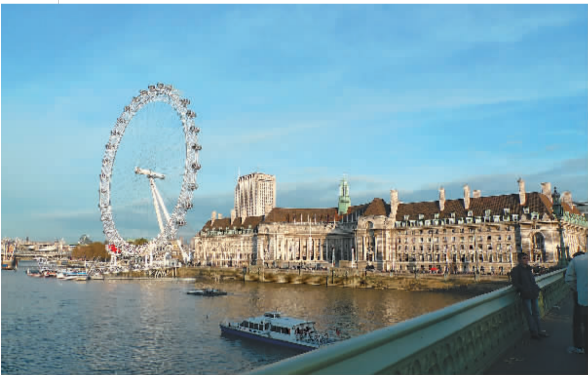
英国最大的摩天轮——“伦敦眼”坐落在泰晤士河畔。

正如英国的全称所描述的那样，来自世界各地的人来到这里组成了这个“联合王国”，带着他们自己的信仰、创意、手工艺和历史，最终让每一个来到这里的人都能深刻感受到这座小小岛国古典而现代、矛盾却和谐、伟大且独特的多面印象。