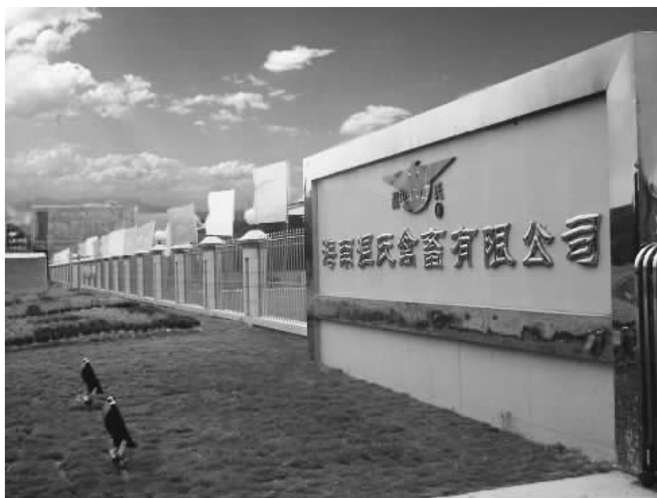
海南温氏禽畜有限公司向农民提供鸡(猪)苗、饲料、技术等,并帮农民销售猪和鸡,带动儋州市960多农民每年户均实现养殖收入4万元至10万元,成为岛内带动农民增收规模最大的畜牧龙头企业。