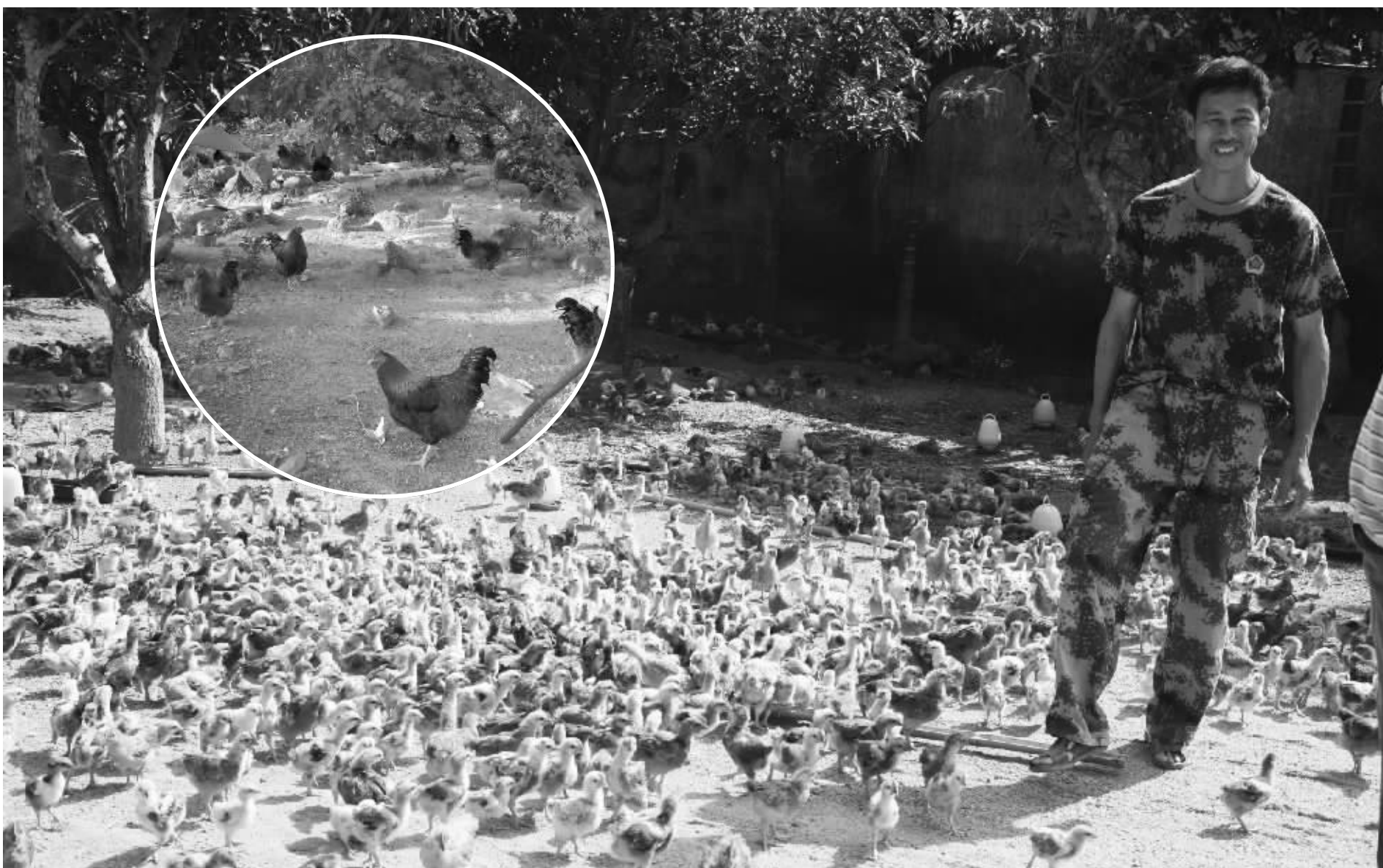
海南永基公司扎根保亭,引导9个乡镇农民成立180个什玲鸡养殖专业合作社,向1050个养鸡专业户发放90万鸡苗,打造海南又一特色鸡品牌—什玲鸡,带动山区农民特色养殖致富。