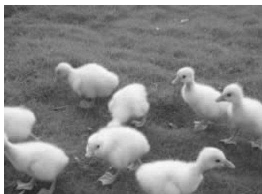
海南海平达实业公司,不仅是我省生猪养殖龙头企业,也是我省最大的种鹅基地,年产80万只白莲鹅苗,带动1000多户农民养殖致富。图为该公司种鹅场。

2010年,农民人均畜牧业纯收入达到1250元,占农民年人均纯收入比重的24%,连续5年保持高速增长态势。