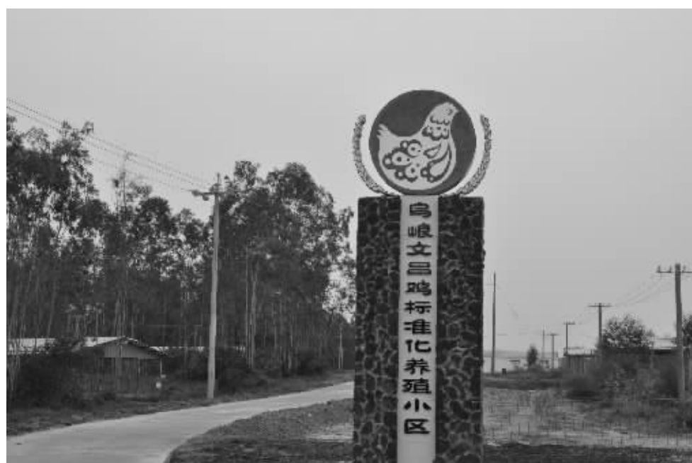
引导农民与企业共建标准化养殖小区,让农民加入畜牧业产业化大军,是我省畜牧业发展带动农民致富的新经验。图为潭牛文昌鸡公司与农民共建的标准化养殖小区。

“十一五”期间,海南畜牧业产业化程度迅速提高,从37%增加到73%,涌现出1.3万个畜禽规模养殖场或养殖户。海口罗牛山公司、儋州温氏公司、海口美健公司、海南永基公司等养殖龙头企业共建标准化、规模化养殖小区近400个,通过“统一种苗、统一饲料、统一防疫、统一管理、统一销售”的“五统一”模式,帮助农民分享畜牧产业化发展成果。