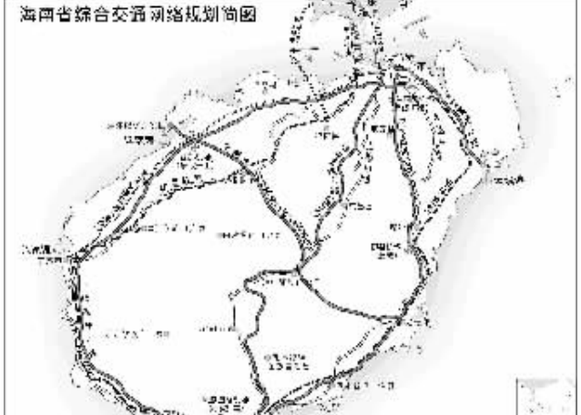
海南省综合交通网络规划图