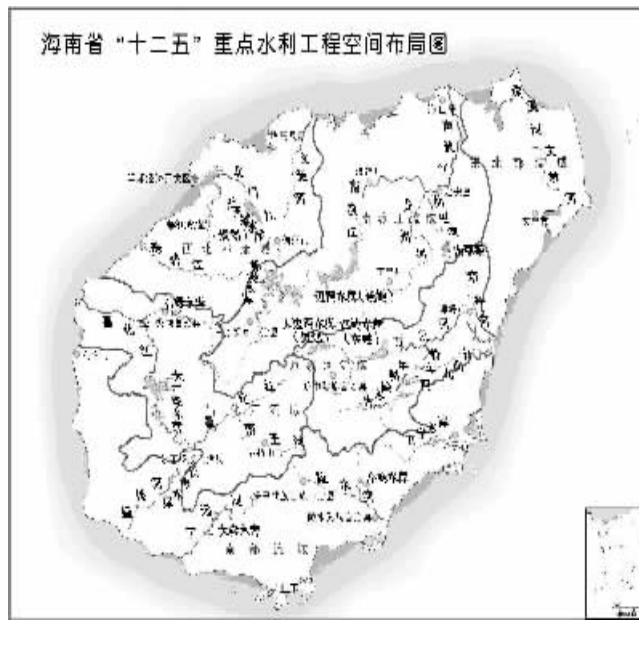
海南省“十二五”重点水利工程空间布局图

(三)水利建设。构建覆盖全岛的南渡江流域、昌化江流域、万泉河流域、东北部流域、南部流域和西北部流域六大流域水利发展格局。加快推进红岭水利枢纽工程、红岭水利灌区工程、迈湾水库、天角潭水库、洋隆水库的建设,以及春江水库、石碌水库扩容。完成大广坝水利二期工程建设,实施海口南渡江调水工程,加快松涛灌区等续建配套工程。完成大中型和七百多个小型病险水库除险加固任务。全面完成南渡江、万泉河、文昌河、昌化江、环小海防洪治理工程。加强南渡江等河流的冬季蓄水功能建设。加强重点海堤和易涝洼地的综合治理,全面提升抗灾防洪标准。合理配置农业用水、城市用水、旅游区用水、生态用水。进一步加强水利工程、水资源利用的管理。