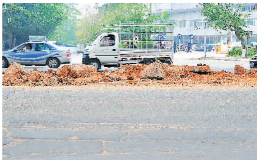
↑ 2日上午,南海大道汽车南站附近中间被破坏的绿化带至今仍未恢复。

本报海口3月2日讯(记者古月)今天上午,海口南海大道金牛路十字路口,一位市民骑电动车从封堵的隔离板缝隙穿越南海大道时,被刹车不及的大卡车挂倒,虽未造成严重伤害,但市民被吓得坐在地上半天起不来。 “东环铁路工程已完工两个多月,南海大道多个十字路口至今仍被封堵,红绿灯也没有恢复使用,我们出行感觉很不安全”,“虽然一些路段中间被挡住,而机动车、电动车和行人可以随意穿越,南海大道上的车速又都很快,由此留下极大安全隐患”,“铁路修完了,公路却搞得不成样子,也不及时修复,机动车、非机动车、行人在路上乱窜,如此交通咋就没人管?”在现场,一些市民对海南日报记者说。