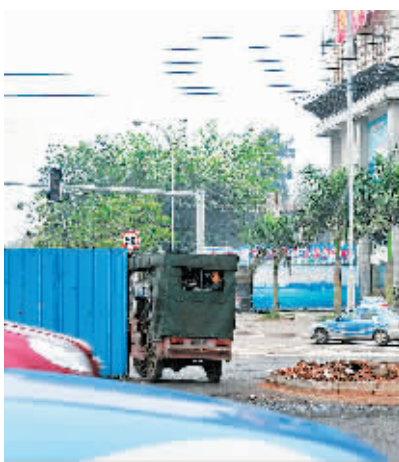
→ 2日上午,一辆三轮车从南海大道与坡巷路十字路口的挡板穿过南海大道。