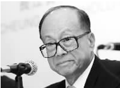
李嘉诚蝉联全球华人首富

福布斯今年富豪榜冠军亚军排名与去年相仿,依旧是墨西哥的卡洛斯·斯利姆、美国的比尔·盖茨和巴菲特,三者身家依次为 740 亿、560 亿、500 亿美元。(来源:中新网)