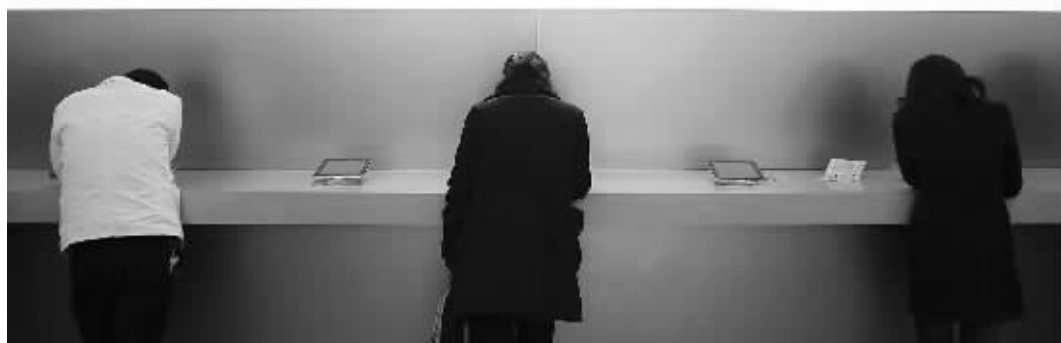
近日,苹果中国启动 iPad 差价退款。据了解,3月3日前两周以内,通过苹果中国在线商店以及美国直营的苹果 Apple Store 零售店订购第一代 iPad 的用户可以得到全额补差退款。

记者从苏宁、永乐和国美电器等大型经销商处了解到,自苹果公司打响降价令后,公司就相继宣布对 3 月 3 日前两周购买 iPad 的消费者予以差额补贴,但所拿出的补贴款都是由商家先行支付。苏宁和国美电器 9 日表示,截至目前已经为此各垫付了数百万元。