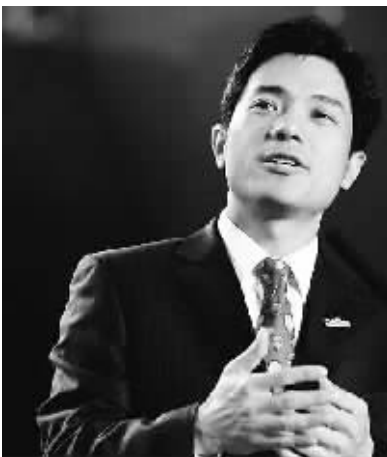
李彦宏成为首名进入该排行榜前百的中国大陆富豪。

本报讯 2011 福布斯全球富豪榜 9 日在纽约发布,百度董事长李彦宏以 94 亿美元的身家成为中国内地首富。三一集团的梁稳根和娃哈哈的宗庆后则分别以 80 亿美元和 59 亿美元排名第二、三位。