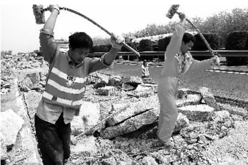
今年作为“十二五”开局之年，司法打击腐败需要继续努力不能松懈，而制度防腐更显得重要。图为由于建设质量存在严重问题河南薛店至长葛高速公路上一段路正在进行维修(资料照片)。