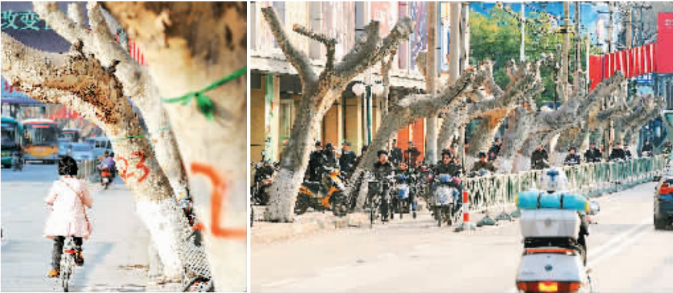
南京太平南路一地铁施工点附近的一排梧桐“修整”后留下树干。