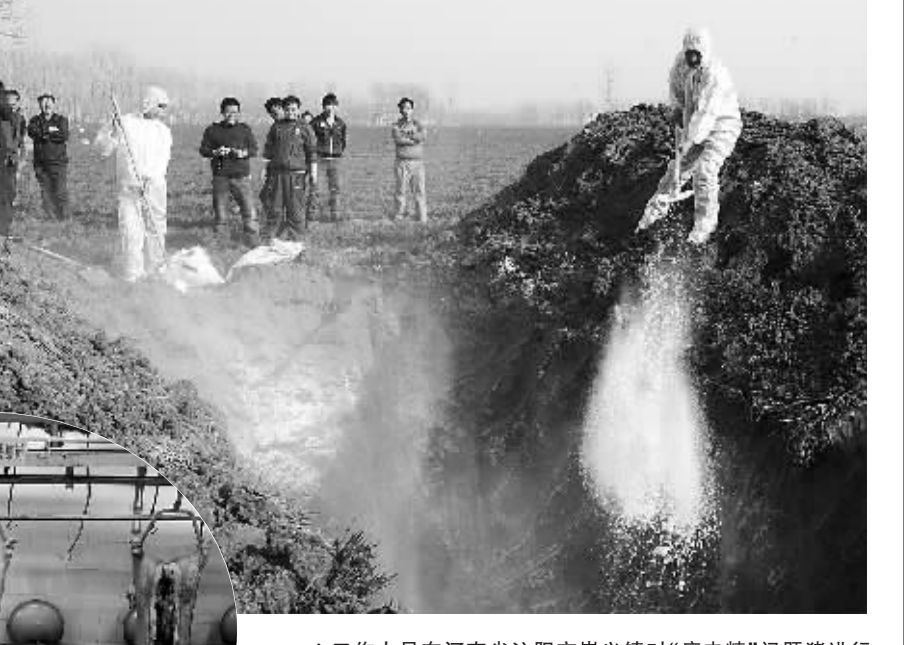
↑工作人员在河南省沁阳市崇义镇对“瘦肉精”问题猪进行捕杀并无害化处理。 ←济源双汇食品有限公司已查封的生产车间。

“癌症爸爸”30万字的“网络家书”在网上流传，感动无数网友，单篇日记阅读量近7000次，五湖四海的网友们，认识的、不认识纷纷跟贴留言，为他加油鼓劲。