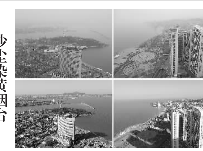
图左上、图右上：沙尘天气影响下的烟台(3月19日摄)；图左下、图右下：晴空万里的烟台城区(3月8日摄，本版照片)。3月19日，受强冷空气影响，地处我国东部沿海的烟台市出现沙尘天气，港城天空被“染黄”。新华社记者 郭雷雷 摄

据新华社长沙3月19日专电 (记者 苏晓洲)为强化在命案侦破过程中协调、组织和联动，长沙警方17日宣布，接到命案警情后，包括市公安局局长在内，实行“六长”必到案发现场的制度。