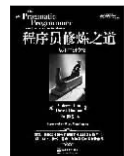
作者：[美]亨特 电子工业出版社 2011年2月

《程序员修炼之道》由一系列独立的部分组成，涵盖的主题从个人责任、职业发展，直到用于使代码保持灵活、并且易于改编和复用的各种架构技术，利用许多富有娱乐性的奇闻轶事、有思想性的例子及有趣的类比，全面阐释了软件开发的许多不同方面的最佳实践和重大陷阱。无论你是初学者，是有经验的程序员，还是软件项目经理，本书都适合你阅读。