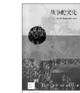
[以]马丁·范克勒韦 尔德 著 李阳 译 生活·读书·新知三联书店

本书以精辟的论证，推翻了“战争只不过是政治通过其他手段的延伸”这一观念。作者认为，战争本身也是一个目的，这种目的体现在战争的文化中。