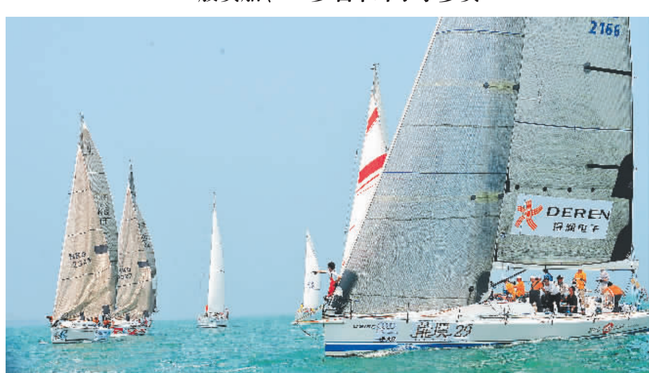
3月20日,环海南岛国际大帆船赛启航仪式在海口秀英码头举行。参赛船只在进行场地赛。