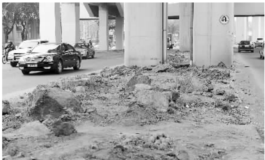
海口南海大道汽车南站至秀英段绿化带带破损严重。

介绍,目前南海大道出现的问题很多,不仅路面损坏严重,而且管网、照明、绿化等设施也严重受损,再加上道路两旁小货车乱停乱放以及车辆随意掉头和从路中穿梭,整条道路“受伤”严重,已经到了非修不可的地步了。 该负责人说,对于南海大道现状因施工破损部分,东环铁路施工单位负责进行维修,但是老是修补,也不是办法,而且整条道路因为施工造成破损的地方不仅仅是路面,因此,需要进行全面整治和改造。 据了解,为了彻底解决这一问题,去年海口市便已将南海大道整治列入计划,准备在东环铁路建设工程竣工后,对南海大道进行一次“大修”。 海口市城市建设投资有限公司有关负责人介绍,目前南海大道整治工程正在进行改造整治的前期工作,包括道路勘察、设计、可行性研究等。该负责人说,该路整治的前期工作繁杂,需要一项项完成,才能最终确定动工时间。据他透露,南海大道整治工程仅在原来的基础上进行大规模整治,并恢复中间绿化带,而不是重新新建,具体整治方案正在制订中,预计今年5月初出台,并计划8月份正式动工。