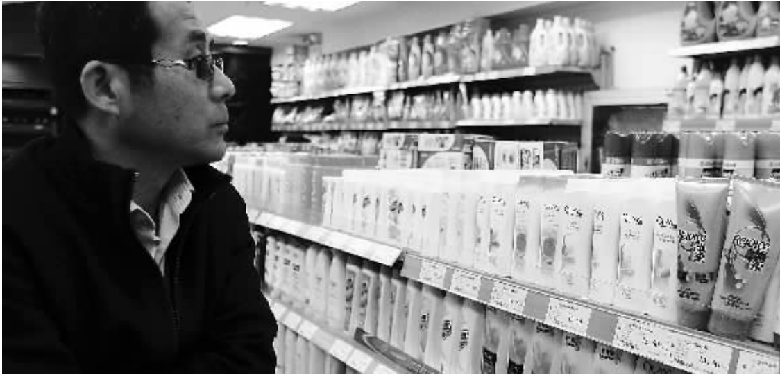
3月24日拍摄的上海某超市日化产品货架,外资企业产品占据显著位置。

不少洗涤日化品牌厂商在三月初开始陆续发来涨价通知,将从下月开始提价,涨幅从5%—10%不等,涉及飘柔、力士、夏士莲、碧浪、汰渍、立白、樱雪、六神、雕牌等大部分洗涤类日化品牌。据一家超市的负责人透露,目前由于该超市仍有大量库存,所以暂时没