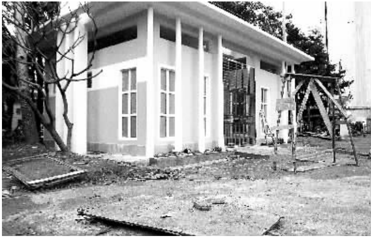
国贸街心绿地的公厕工地外围凌乱。

有通水通电,更没有正式交付使用,不仅周边的居民和行人上厕所成问题,混乱的现场也影响到她们日常的绿化养护工作。