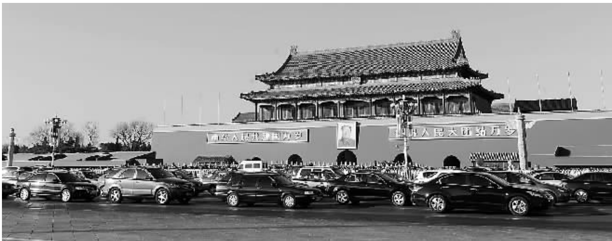
机动车在北京长安街上行駛。

费用=310万元。网友“没晕菜”的观点代表了大多数网民的观点：“车是这么多！但主要是，这些车花了多少钱？这也是百姓想要知道的。”