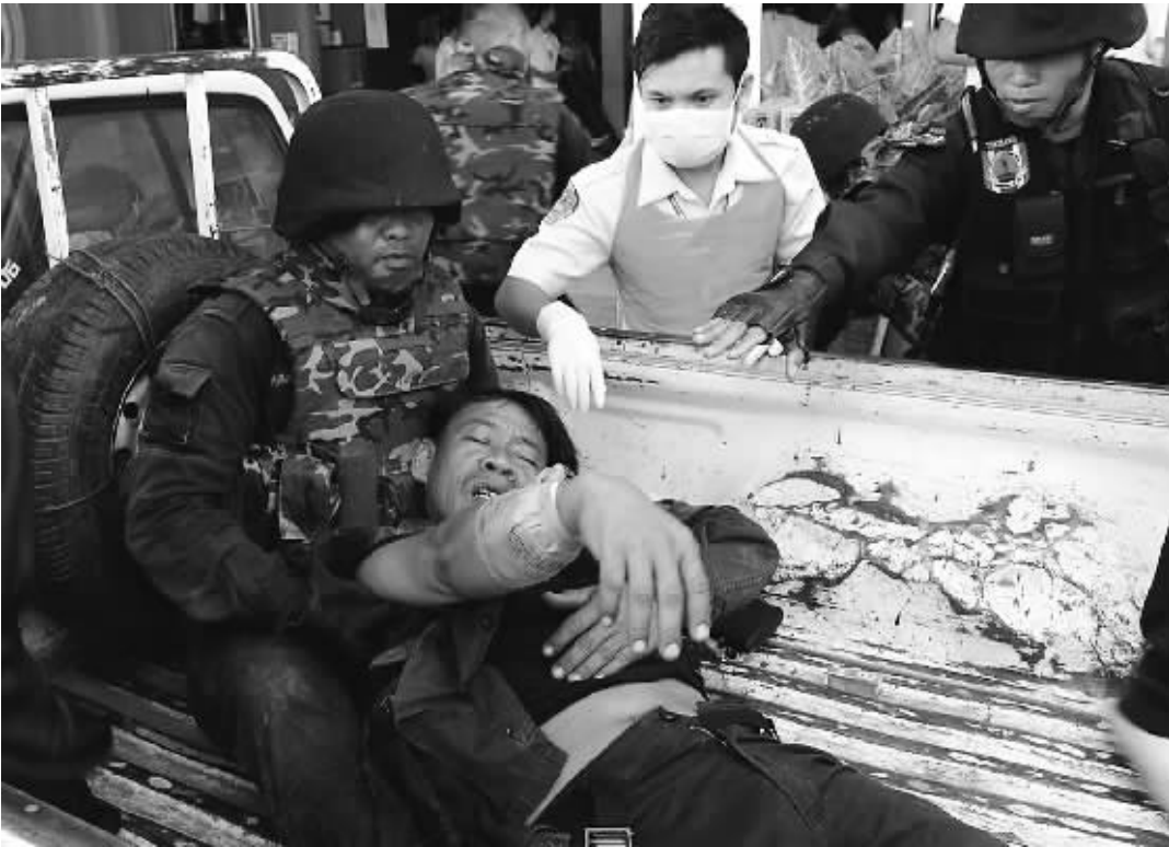
4 月 22 日,一名受伤的泰国士兵被送往素林府的一家医院。

泰国和柬埔寨边境部队 22 日早晨在边境争议地区交火,6 名士兵死亡,至少 12 人受伤。两国均指责对方率先开火。 东南亚国家联盟轮值主席国印度尼西亚当天呼吁双方立即停止敌对行动,通过和平方式解决分歧。 打了四个钟头 柬埔寨国防部发言人春索吉说,交火地点位于柬埔寨奥多棉吉省与泰国素林府接壤地区。双方 6 时左右发生交火,持续至 10 时 10 分。 法新社报道,双方展开枪战,发射榴弹和火炮。泰柬各 3 名士兵在交火中身亡,至少 12 人受伤,其中 3 名泰国士兵伤势严重。 泰国政府紧急疏散附近地区大约 7500 名村民,柬埔寨政府疏散大约 200 户家庭。 这次冲突围绕泰柬存在归属争议的达莫安通寺及附近另外一座寺庙。达莫安通寺建于公元 13 世纪,位于泰柬另一处“敏感地区”柏威夏寺以西大约 200 公里。 泰柬 2008 年 8 月因柏威夏寺争端,分别在达莫安通寺两侧陈兵对峙,后会会谈达成部分撤军协议。 两国今年因柏威夏寺争端已多次交火,致死至少 10 人。联合国安全理事会 2 月呼吁泰柬保持“最大限度克制”,实现永久停火。 互指对方“挑事” 泰柬两国均指责对方挑起冲突。