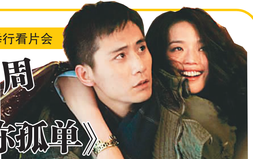
《不再让你孤单》剧照

本报海口5月6日讯(记者卫小林)虽然海南的电影市场总量较小,但随着本地电影市场的不断壮大,仍然赢得了国内电影界巨头的关注。今天上午,在国内电影制片界和发行界享有声誉的博纳国际影业集团专程来琼,在海口中影南国影城举行爱情片《不再让你孤单》看片会,正式宣布该片将于5月13日起在海南上映。