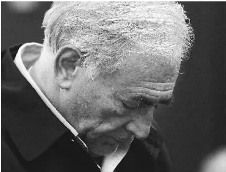
↑卡恩在纽约出席法庭听证会的资料照片。

奥巴马签署总统令说,鉴于叙利亚政府对叙利亚民众使用的暴力“持续升级”,他下令自18日中午起对包括总统阿萨德、副总统沙雷、总理萨法尔以及内政部长和国防部长在内的7名叙利亚政府高官实施制裁,冻结他们在美国境内的资产。