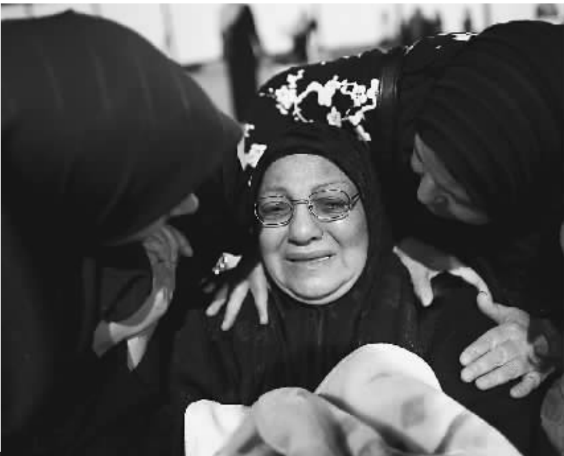
一名利比亚妇女在班加西抱着死去儿子的画像哭泣。