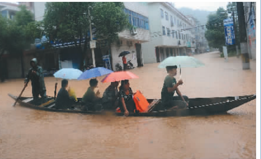
在位于钱塘江上游的浙江省常山县城南部,人们在强降雨时乘船转移(6月19日摄)。

在位于钱塘江上游的浙江省常山县城南部,人们在强降雨时乘船转移(6月19日摄)。