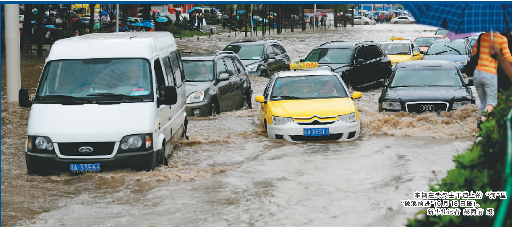
车辆在武汉主干道路上的“河”里“破浪前进”(6月18日摄)。新华社记者 郝向前 摄

6月21日17时20分,重庆主城区一路口处道路通畅。 重庆推出打造“不塞车的城市”计划,近期将开展畅通主城10大行动,计划到2015年,城市道路周期性堵点、拥堵路段数量较2010年减少50%以上,主要干道高峰时段平均车速达到30公里/小时左右,轨道交通占公共交通总量比例达到50%以上。 新华社记者 周衡义 摄