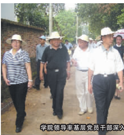
学院领导率基层党员干部深入文明生态村调研

切实用中央的指示精神统一各级的思想。每次重大主题教育和实践活动展开前，学院党委都深入进行思想调查，有针对性地开展