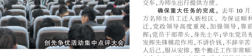
创先争优活动集中点评大会

一是制定颁发有关工作细则与规定。学院党委制定下发了《中共海口经济学院委员会职责》、《中共海口经济学院委员会工作暂行条例》等文件，还颁发了《关于发展党员