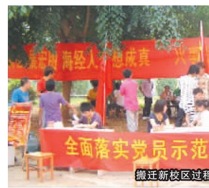
全面落实党员示范岗要求，为学院搬迁新校区过程中的“党员志愿服务队”

切实抓好科学理论的武装。党委把每次参加重大学习实践活动的过程作为用科学理论武装党员干部的过程，潜心抓好党的创新理论的学习。先进性教育中，组织党员