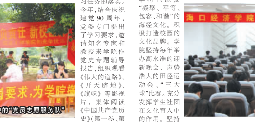
海口经济学院创先争优活动集中点评大会

切实推进学习型党组织建设。学院党委作出了《关于加强学习型党组织建设的决定》。每年制定学习计划，明确学习内容，购买下发有关学习书籍与影视资料等，抓好学习任务的落实。