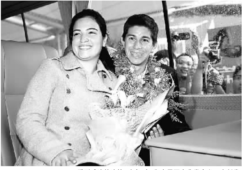
受到球迷的追捧，孔卡(右)和妻子两人非常高兴。小新家

本报讯 7 月 11 日下午，在中超二次转会期间，广州恒大斥资千万美元引进的巴甲最佳球员孔卡抵达广州。孔卡是中超联赛最贵的外援，也是中国足球队有史以来引进的身价最高的外援。在广州白云机场，孔卡受到了恒大球迷的热情追捧，恒大俱乐部董事长刘永灼亲自到机场迎接。遗憾的是，从大连返回广州的恒大队因航班晚点，未能到机场与孔卡签约。 按照之前签约时的计划，孔卡将在 11 日来到中国。孔卡是专门从多哈转机而来。11 日下午 15 点 30 分，孔卡乘坐的卡塔尔航空公司 QR874 抵达了广州。广州一直下着倾盆大雨，但这丝毫没有阻止球迷们前往机场迎接孔卡的热情。