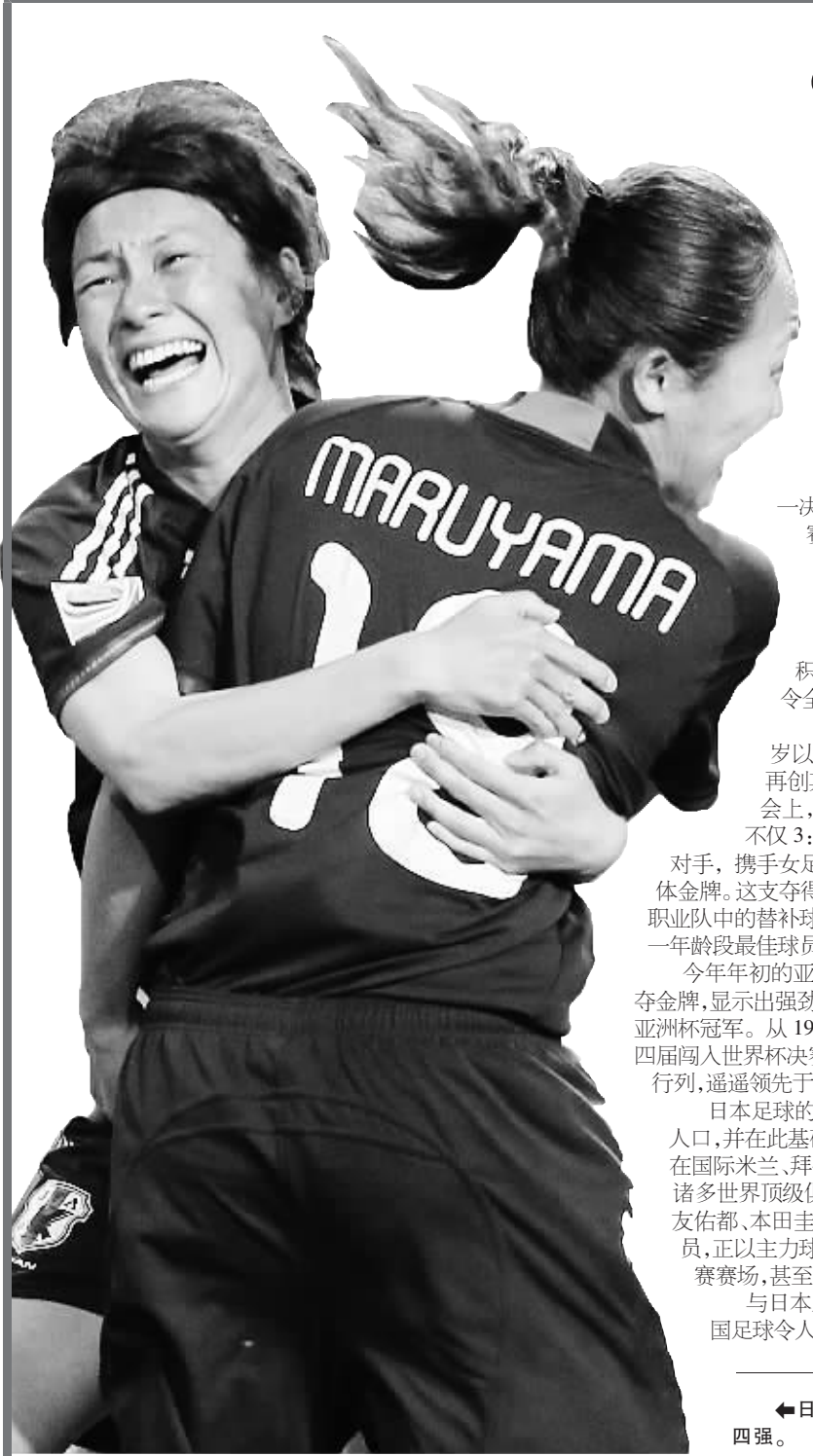
日本女足队员庆祝打入女足世界杯四强。

为日本足球崛起奠定坚实基础的本田雅彦名誉主席川渊三郎，是日本 J 联赛的创始人，有着日本“足球教父”的美誉，是日本足球近二十年来突飞猛进的一大功臣。 生于上世纪三十年代末的川渊三郎，虽已年过古稀，但仍然相当有精神。他 7 月上旬来到北京，除了与中国足协进行深入的交流外，还在中国足球论坛等一系列场合，与中国足球的从业者进行了深入的交流。儒雅的川渊三郎毫无保留地与中国足球从业者分享日本足球近二十年来“井喷”背后的经验和教训。