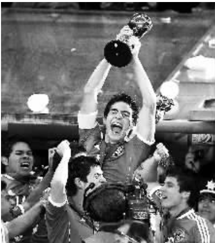
墨西哥队球员高举冠军奖杯庆祝。

本报讯 北京时间 11 日凌晨，在美洲杯 A 组的一场比赛中，哥伦比亚 2:0 战胜玻利维亚，哥伦比亚锁定 A 组头名出线。与此同时，B 组委内瑞拉、C 组的智利和秘鲁也同时出线。 根据美洲杯规则，12 支队伍总共被分为 3 组，其中 3 个小组的前两名直接出线晋级八强，另外 3 个小组第三名中成绩最好的两支球队也晋级八强。目前哥伦比亚积 7 分，锁定 A 组第一已经提前出线。同组哥斯达黎加 3 分，阿根廷 2 分，两队在当地时间 12 日上午 8:45 进行小组赛最后争夺，来决定谁是小组第二、谁是小组第三。 哥斯达黎加与阿根廷最后一轮直接对抗，决定了 A 组不可能出现 4 分或超过 4 分的球队第三，所以 B 组积 4 分的委内瑞拉、C 组 4 分的智利和秘鲁也同时出线。 目前各组出线情况分析如下： A 组：哥伦比亚 7 分(晋级)、哥斯达黎加 3 分、阿根廷 2 分、玻利维亚 1 分(被淘汰) 哥斯达黎加末轮对阵阿根廷，打平或取胜将以第二身份直接晋级；阿根廷取胜直接晋级小组第二。阿根廷如排名小组第三，可看其他小组情况，仍有出线机会。 B 组：委内瑞拉 4 分(晋级)、巴西 2 分、巴拉圭 2 分、厄瓜多尔 1 分 末轮委内瑞拉对阵巴拉圭，巴西对厄瓜多尔。巴西和巴拉圭情况雷同，均是取胜即可小组直接出线，厄瓜多尔也是取胜即可直接晋级。巴西打平或者输球，命运将不掌握在自己手中。 C 组：智利 4 分(晋级)、秘鲁 4 分(晋级)、乌拉圭 2 分、墨西哥 0 分 末轮智利对阵秘鲁，乌拉圭对阵墨西哥。乌拉圭和墨西哥争夺最后一个小组出线名额，乌拉圭取胜即可晋级，墨西哥取胜将看其他小组的情况第三情况，乌拉圭打平也需要看其他小组的情况第三情况。(伊雷)