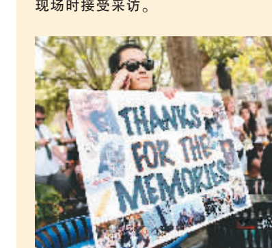
影迷在首映式现场打出标语:“感谢那些回忆”。

电影的两名导演、制片人、剧本作家及剧中其他演员也走上红地毯。在影迷们震耳欲聋的欢呼声中,演职人员发表了简短讲话,回顾了十多年来系列电影的发展历程,并对影迷的支持表示感谢。