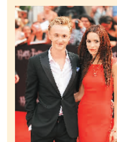
汤姆·费尔顿(左)抵达首映式现场。