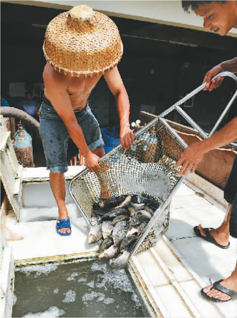
七月十三日,文昌市潭牛镇潭源大冰氧制品有限公司的工人正在给运送活鱼的货车加冰打氧。据悉,潭牛镇罗非鱼养殖面积一点八六万亩,年产量一点八八万吨,产值超过一点六亿元。罗非鱼产业化带动了该镇加工、运输、销售、服务等行业的快速发展。

考生遇到困难和疑惑，可通过三种方式进行咨询、投诉。一是登录省考试局网站的“普通高考查询站”进行网上信访；二是拨打省考试局在录取现场设立的热线电话（65854237）和投诉电话（65853852）；三是在美华荷泰酒店设立的省考试局信访接待站进行咨询和投诉。