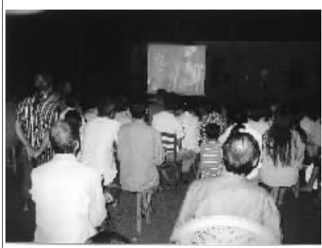
2010 年 5 月，琼中县支中心组织黎母山镇大塘村群众观看“养鸡技术”科教片