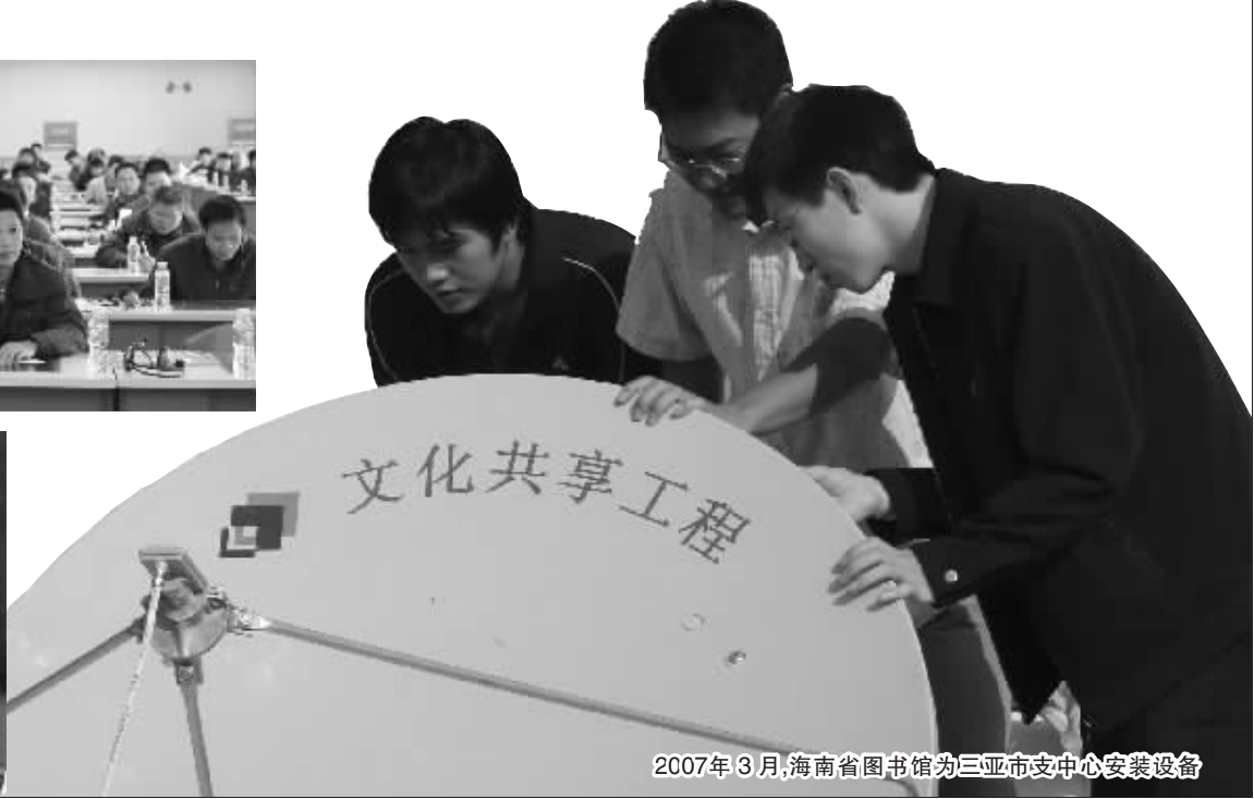
2007 年 3 月，海南省图书馆为三亚市支中心安装设备