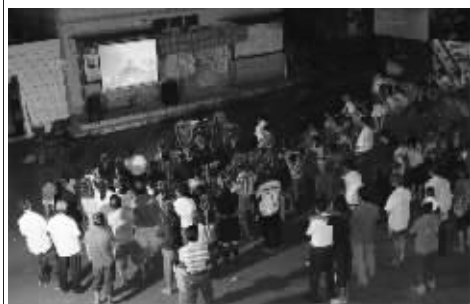
2010 年 12 月，五指山市支中心到水满乡开展文化共享工程基层服务活动