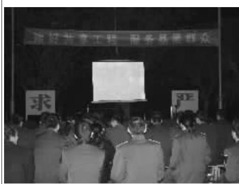
2010 年 12 月，昌江县委支中心到部队放映文化共享工程优秀电影资源