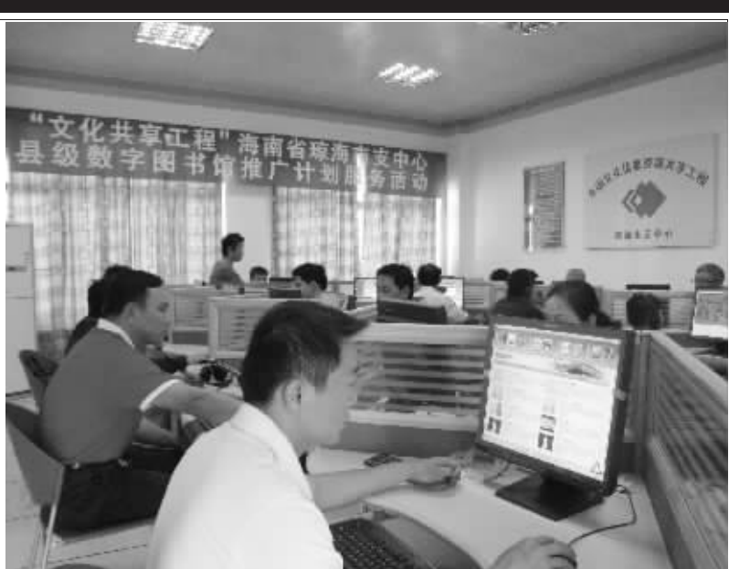
2010 年 2 月，琼海市支中心开展“县级数字图书馆推广计划”服务活动

践证明，文化共享工程是改善城乡基层文化服务的创新工程，是深受基层群众欢迎的民心工程。省文体厅厅长范晓军表示，要总结经验，趁势而为，开拓创新，充分利用现代信息技术的成果，全面推进工程建设，在实现和保障人民基本文化权益方面迈出新步伐、开创新局面，使文化共享工程真正成为我省公共文化服务体系建设和领域充满生机与活力的新平台，从而为推动社会主义文化大发展大繁荣，更好地满足人民群众日益增长的精神文化需求，为建设海南国际旅游岛做出新的更大贡献。