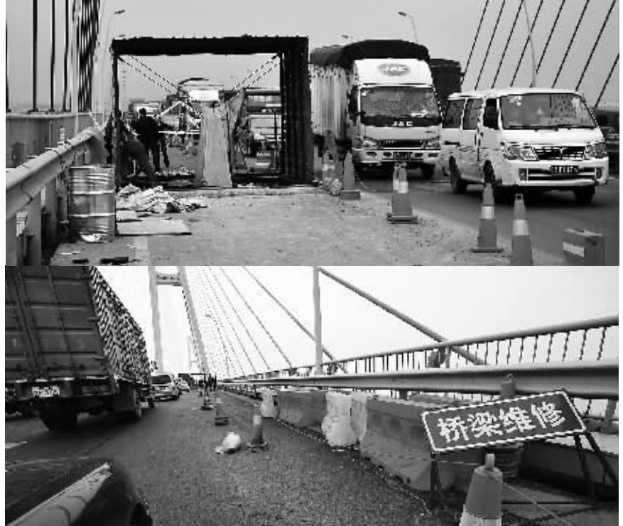
上图:车辆正在维修中的武汉白沙洲长江大桥上通过。 下图:修复屡坏,屡修屡坏的武汉长江三桥的常例。

浙江杭州钱江三桥突然塌了,江苏盐城通榆河桥瞬间垮了,福建武夷山公馆大桥轰然倒了……近期,各地频繁发生的桥梁安全事故刺痛了社会的神经,更在网络上引发持续关注的热议。 “晒晒我们身边的桥吧!”网民们不仅仅是议论,而是纷纷将目光投向身边的桥梁:有问题的、高质量的……网民们呼吁:大桥的建设者要时刻牢记许多人的生命把握在自己手中,不要去挣那些缺良心的人民币,应自己最大的努力控制工程质量,不要让悲剧重演。 根据网民提供的线索,新华社“中国网事”记者分赴重庆、湖北等地,实地勘察了网民关注度高的几座桥梁的实际情况。