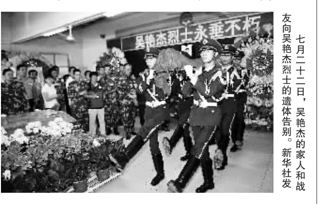
七月二十二日,吴艳杰烈士的家人和战友向吴艳杰烈士的遗体告别。

据新华社新疆和田电 22日上午,武警新疆总队第五支队为“7·18”暴力恐怖袭击事件中英勇牺牲的吴艳杰烈士举行追悼会,当地数百名各族干部群众和吴艳杰生前战友参加了追悼会。吴艳杰1989年11月出生于河南省扶沟县,2009年12月入伍,上等兵警衔。