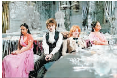
《哈利·波特与火焰杯》:青春期的少年心事重重