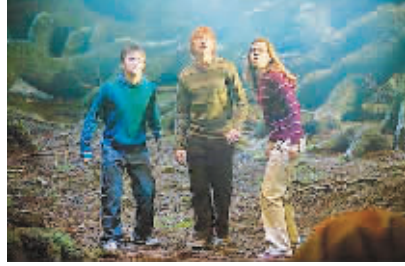
《哈利·波特与凤凰社》:三人组共同面对挑战