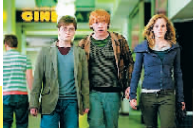
《哈利·波特与死亡圣器(上)》:铁三角离开学校继续战斗

●在拍摄死亡、石化和昏迷咒的时候用了250件身体模具。 ●《哈利·波特》电影系列里一共创造了超过200种生物造型。 ●哈利额头上的伤疤被化妆师画过大约5800次。不止是丹尼尔·拉德克里夫(画过大约2000次),还有他的走位替身和特技替身们都要画上这道伤疤。 ●8位模型制作师花了14周才完成陋居的建造,而把它烧毁只用了6分钟! ●《哈利·波特》电影系列的艺术部门由58位全职工作人员组成。在过去十