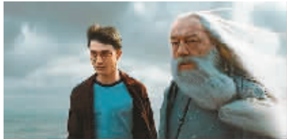
《哈利·波特与混血王子》:哈利与邓布利多