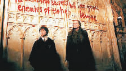
《哈利·波特与密室》:伏地魔势力侵袭霍格沃茨