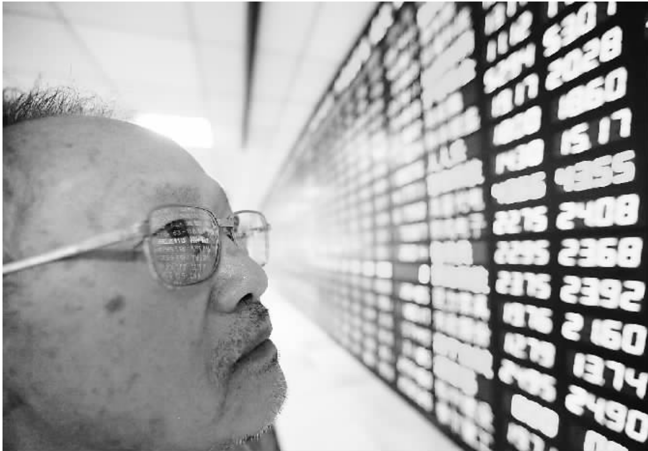
8月8日，股民在上海一家证券交易所关注大盘走势。

本报讯 受标准普尔调低美国主权信用评级等利空消息影响，沪深两市周一早盘跟随外围市场重挫，沪指在低开 after 一路放量重挫，连续失守2600、2500点两大重要关口，盘中一度大跌130余点，最低跌至2497.92点，午后大盘跌幅有所收窄，并在2500点上方缩量震荡。 截至收盘，上证指数大跌99.60点报2526.82点，跌幅3.79%，成交1176亿；深证成指跌389.13点报11312.63点，跌幅