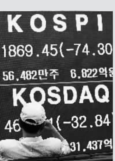
8月8日，在韩国首尔，一位股民注视当天的股价牌。当日韩国首尔股市综合指数和高斯达克指数分别暴跌3.82%和6.63%，并因此临时停盘。

此外，中国香港恒生指数8日报20490.57点，下跌455.57点，跌幅为2.17%。中国台北股市暴跌3.82%，收报7552.8点，下跌了300.33点。