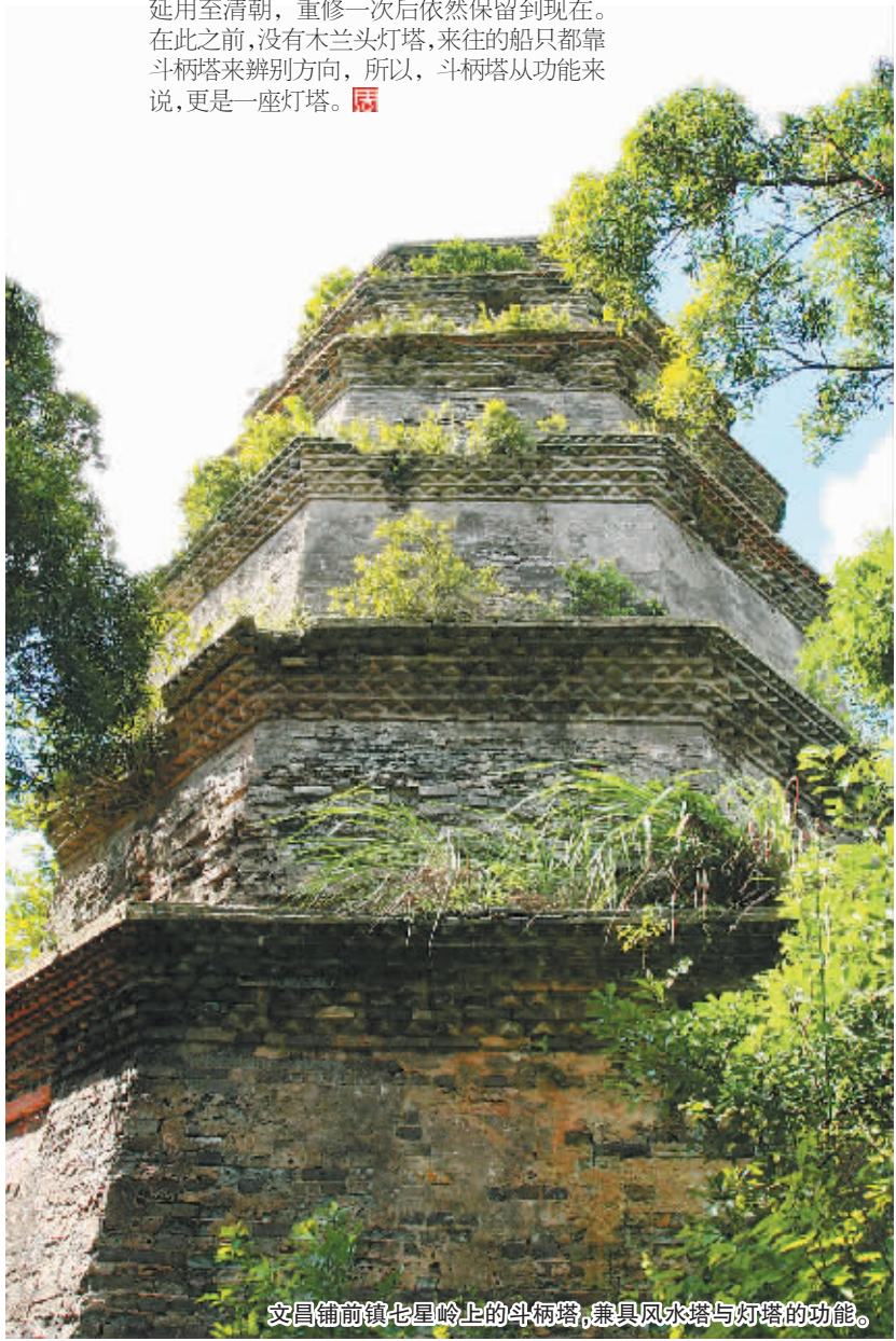
文昌铺前镇七星岭上的斗柄塔,兼具风水塔与灯塔的功能。