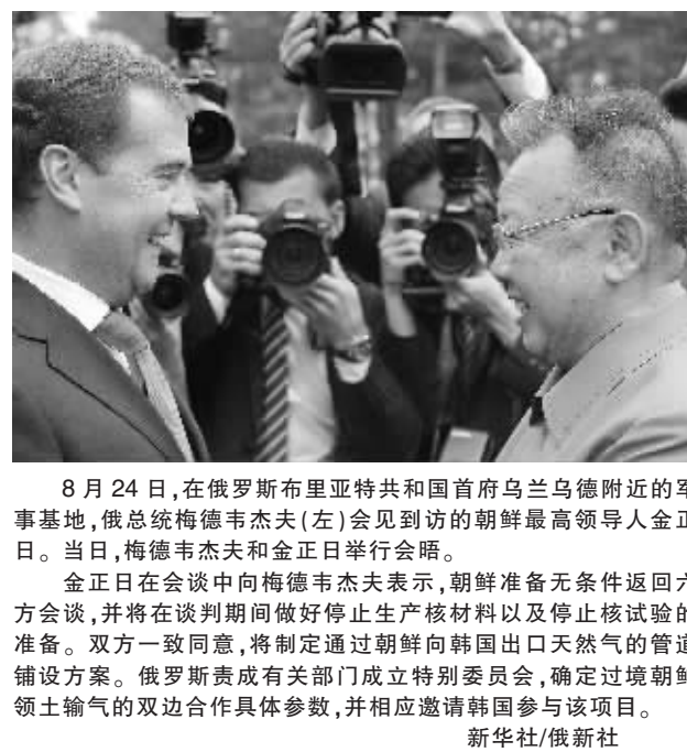
8 月 24 日,在俄罗斯布列斯特共和国首府乌兰乌德附近的军事基地,俄总统梅德韦杰夫(左)会见到访的朝鲜最高领导人金正日。当日,梅德韦杰夫和金正日举行会晤。

金正日在会谈中向梅德韦杰夫表示,朝鲜准备无条件返回六方会谈,并将在谈判期间做好停止生产核材料以及停止核试验的准备。双方一致同意,将制定通过朝鲜向韩国出口天然气的管道铺设方案。俄罗斯责成有关部门成立特别委员会,确定过境朝鲜领土输气的双边合作具体参数,并相应邀请韩国参与该项目。