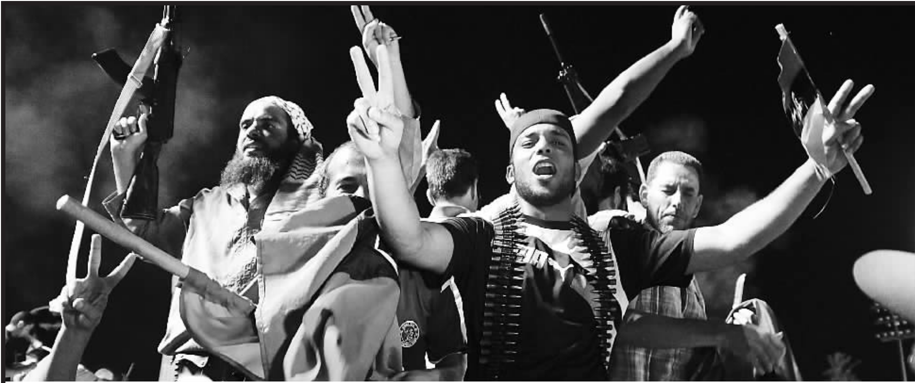
八月二十三日,反对派武装人员在利比亚首都的黎波里的一烈士广场(前称绿色广场)庆祝。