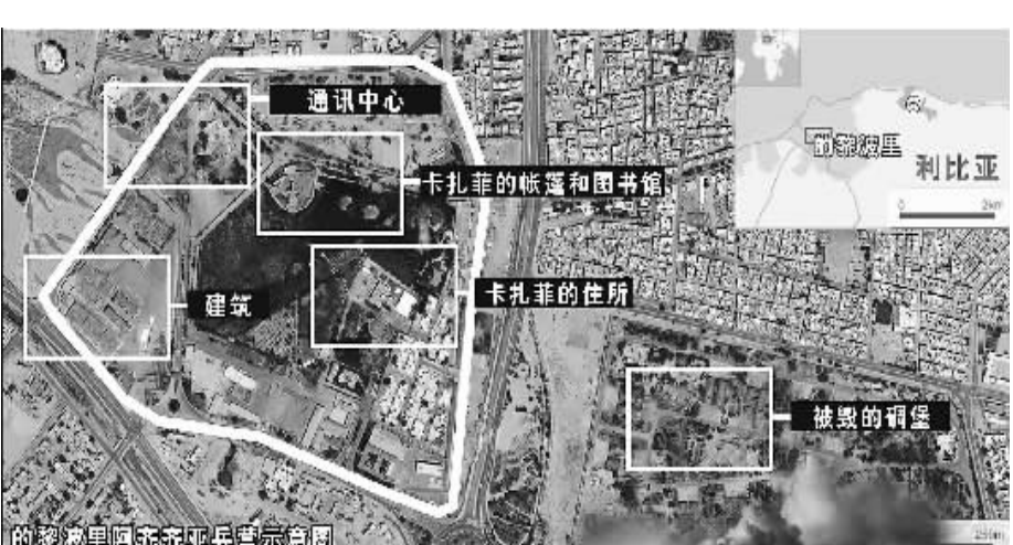
的黎波里阿齐齐亚兵营示意图

对派“全国过渡委员会”将在两日内把总部从班加西迁往首都的黎波里。 当天早些时候,反对派军队已经占领了的黎波里的阿齐齐亚兵营,但未发现卡扎菲及其家人。目前,反对派士兵正对阿齐齐亚兵营进行搜查和清理。 占领的黎波里的阿齐齐亚兵营之后,反对派与政府军在首都的火药味依然激烈,位于市中心外国记者聚集的里克索斯酒店周围仍然枪炮声不断。 据新华社罗马 8 月 24 日电 利比亚反对派“全国过渡委员会”主席贾利勒在 24 日出版的意大利《共和国报》上表示,利比亚将在 8 个月内举行议会和总统选举。 贾利勒说,“我们将在 8 个月内举行选举,我们需要一个民主政府和一部公正的宪法。最重要的是,我们不想像以前那样在世界上被孤立”。