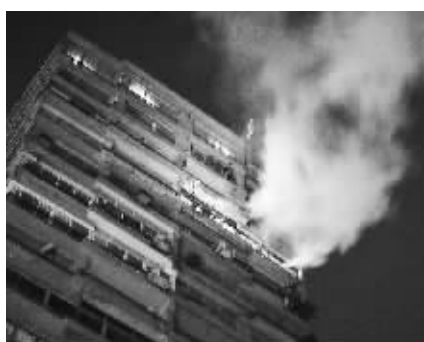
示威者深夜冲进以色列使馆埃及使馆所在的大楼,并从大楼顶部取下以色列国旗。

据新华社北京9月10日电 综合新华社驻外记者报道:埃及抗议示威者9日晚在首都开罗冲击以色列使馆,造成3人死亡、1049人受伤。示威者用大锤、金属棒等工具砸坏并推倒使馆大楼前新修的防护水泥墙,摘下大楼顶部的以色列国旗。一些抗议者进入楼内,并从楼上窗户扔下大量档案文件资料。